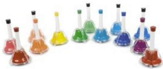
JUEGO COMPLETO 13 CAMPANAS DE MESA Y DE MANO AFINADAS EN DO5 A DO6 REF 195-70610

Sencillo de tocar por lo que es perfecto para la iniciación y el desarrollo del sentido del ritmo. Fabricado en acero brillante. Incluye el martillo. Disponible en 3 tamaños: 13, 16 y 19 cm.