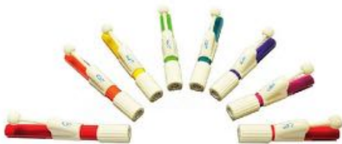
PERCUNOT REF 195-71319

Percunot se compone de 8 tubos. Cada tubo está equipado con un mazo. Sólo hay que agitarla por el mango y el mazo la golpea. Cada nota está coloreada de acuerdo a la codificación de los boomwhackers, juegos de campanas, mini-metalonotas... Recomendado a partir de 8 años.