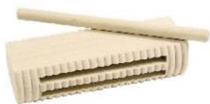
CAJA CHINA GÜIRO REF 195-7699

¡Doble uso! como sonajero y como güiro. Suena al agitarlo y al golpearlo. Fabricado en madera natural pintada. Se suministra con un bastón. Medidas: L. 13 cm – Ø 4,5 cm