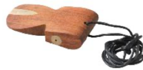
APILO DE SAMBA REF 195-7009

El tamboril no tiene címbalos. Cuerpo en madera Suministrado con una maza.