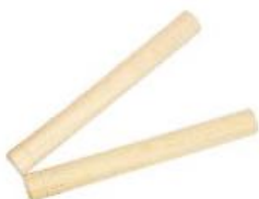
CLAVES ACACIA 14 CM REF 195-7991 18 CM REF 195-7709

Ideal para los más pequeños, para que se inicien en el mundo de la música, del ritmo y para desarrollar la habilidad de agarre. Fabricadas en madera natural.