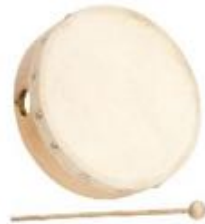
TAMBORIL DE PIEL NATURAL SIN CÍMBALOS

Fabricada en madera natural. Con 8 pares de címbalos. Ø 20 cm.