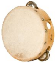
PANDERETA DE PIEL NATURAL 15 CM REF 195-0593 20 CM REF 195-3991

Esta pandereta está compuesta por 8 pares de címbalos. Fabricada con piel natural, muy resistente.