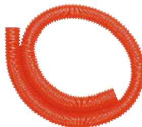
TUBO ARMÓNICO REF 195-5474

Conjunto de 2 x 6 tubos de plástico. Cuando los tubos son sacudidos, producen sonidos diferentes: fuertes, suaves, muy suaves... Las dos filas de tubos son idénticas. Se pueden utilizar para hacer juegos de escucha y reconocimiento. Tamaño del soporte: 38 cm x 13 cm