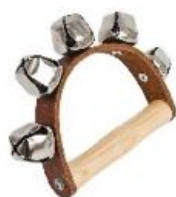
CORONA 5 CASCABELES REF 195-70522

Sólo hay que golpear una con la otra. Al sostener el extremo de una de ellas con la mano se forma la caja de resonancia. Fabricada en madera. Ø 2 cm.