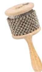
CABASSA - CABASSITA REF 195-70785

Sólo tienes que girarlo y las bolas producirán el sonido al golpear la piel. Con mango de madera y piel natural. Medidas: L. 20 cm – Ø 7 cm