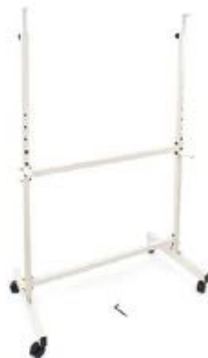
PIE CON RUEDAS PIZARRA MUSICAL REF 195-8789

Atril de excelente calidad. Su estructura metálica es ajustable en altura. Su pies antideslizantes hace que sean más estable y seguro. Tiene un sistema de sujeción para evitar que las hojas se puedan mover o caer. El soporte es orientable. Medidas: Alto 0.66 m. mínimo y 1.05 m. máximo.