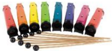
METALNOTAS REF 195-9930

Compuesto por un total de 8 piezas con tesitura carrillón contralto: Do4 a Do5. Están montadas sobre tubos de plástico (tipo "Boomwhackers") para una mayor resonancia y una excelente calidad sonora. Incluye 8 mazas para tocar. Se suministra en una maleta de plástico fácil de transportar. Medidas de la maleta: 43x30x8 cm.