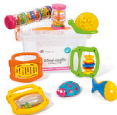
MINI COFRE 8 INSTRUMENTOS REF 195-2931

Pájaro de madera con tres instrumentos musicales, pintados en colores no tóxicos. Xilófono, güiro y tambor. Incluye Baqueta. Edad Recomendada: de 1 a 3 años.