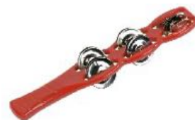
SISTRO REF 195-8274

Fabricada en cuero y madera. Con 5 cascabeles. Muy fácil de tocar. Medidas: 16 x 9 cm. Apta para todas las edades.