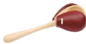
CASTAÑUELAS CON MANGO REF 195-70774

Esta corona de platinillos de media luna será agradable de usar gracias a su mango ergonómico. Está equipado con una doble fila de platinillos, 8 pares en total. PVC Ø 23 cm. El color puede variar.