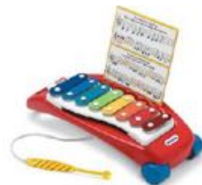
XILOFONO REF 24-6122