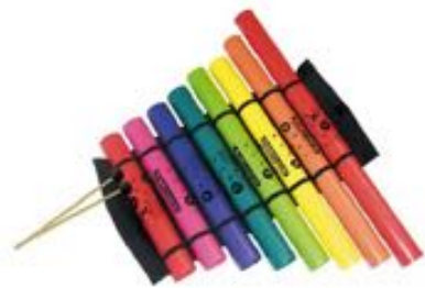
ESTUCHE COMPLETO REF 195-8337

Compuesto por un lote de 5 tubos que recrean las notas Do, Re, Mi, Sol, La, Do. Contralto Do4 a Do5. Medidas comprendidas desde 63 cm a 30 cm.