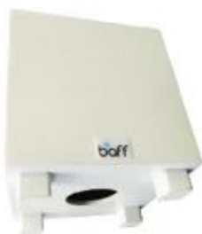
CAJÓN BAFF 30X26X26 CM BLANCO REF 195-71294 VERDE REF 195-71296