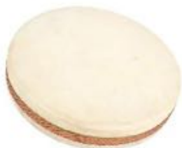
TAMBOR OCEÁNICO 20 CM REF 195-70624 25 CM REF 195-70625 35 CM REF 195-9339 40 CM REF 195-9451

TAMBÚ es un precioso instrumento musical para iniciarse en este fascinante mundo. De sonido aterciopelado suelen estar vinculados a talleres de relajación. El TAMBÚ puede hacerse sonar de diferentes maneras. Viene acompañados de partituras en números y colores para aquellos que empiezan. Incluye: 2 baquetas, 4 púas de dedos, partituras y una atractiva bolsa de transporte. Recomendado a partir de 3 años.