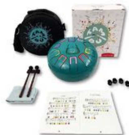
TAMBU TURQUESA REF 324-JCTMB08T

TAMBÚ es un precioso instrumento musical para iniciarse en este fascinante mundo. De sonido aterciopelado suelen estar vinculados a talleres de relajación. El TAMBÚ puede hacerse sonar de diferentes maneras. Viene acompañados de partituras en números y colores para aquellos que empiezan. Incluye: 2 baquetas, 4 púas de dedos, partituras y una atractiva bolsa de transporte. Recomendado a partir de 3 años.