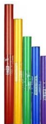
BOOMWHACKERS CROMÁTICO COMPACTO DE 5 UDS. REF 195-3461

La gama extensión propone 7 tubos con los que tendrás la posibilidad de alargar la serie Contralto. Compuesto por un lote de 5 notas. Medidas comprendidas desde 28 cm a 19 cm.