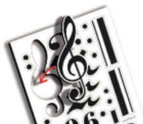
PENTAGRAM BOARD & NOTES REF 1-94120

Pizarra musical pautada cuya parte trasera se adhiere sobre cualquier superficie plana. Se puede quitar y poner las veces que sea necesario, con la tranquilidad de que no deja residuo, al ser removible y reutilizable. Incluye 85 figuras musicales magnéticas para crear composiciones sobre el pentagrama. Permite la escritura con un rotulador borrable (no incluido). 1 Pizarra pautada removible, 85 figuras musicales magnéticas y 1 folleto. Medidas: 120x30 cm. Recomendado de 3 a 6 años.