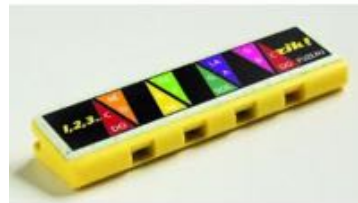
LOTE DE 12 ARMÓNICAS REF 195-71371

Armónica 4 agujeros - Hohner. Sintonizado en C, con un mecanismo de cobre, diseñado específicamente para el aprendizaje. Se coloca una pegatina con el código de color y el nombre de las notas en francés e inglés.