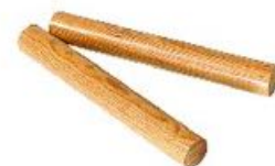
CLAVES DE COCO REF 195-0539

Instrumento de percusión tradicional de la música irlandesa. Ideal para iniciación en la música. Sólo hay que golpear la piel en el medio con la maza, de modo que ambos extremos reboten. La mano que sostiene el instrumento puede jugar con la tensión de la piel para variar el sonido. Medida: Ø 20 cm. Incluye la maza.