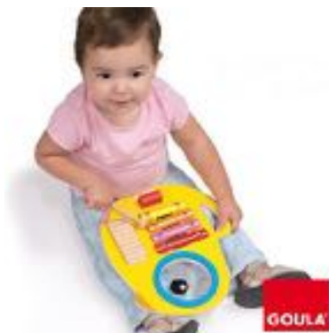
TIKI MUSICAL 3 EN 1 REF 59-53132

Selección de 16 instrumentos para crear sesiones de actividades musicales donde cada niño escogerá su instrumento. Los colores y ritmos animarán la clase. A partir de 3 años. Medidas del cofre : A. 38,5 cm – P. 28 cm – Alt. 24 cm.