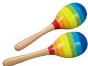
PAR DE MARACAS 20 CM REF 105-61922