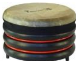
TAMBOR TROMMUS 21 X 34 CM REF 195-71352