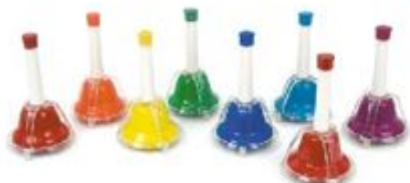
JUEGO DIATÓNICO. 8 CAMPANAS DE MESA Y DE MANO REF 195-70608

Gracias a su mango ergonómico, este timbre de metal ofrece un agarre fácil e inmediato. Para que resuene, use el mazo para golpear el instrumento en su superficie interior o exterior. Ideal para despertar musical. Suministrado con mazo. Formato: 18 x 10 x 5 cm.