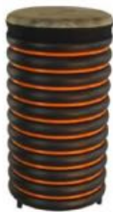
TAMBOR TROMMUS 53 X 28 CM REF 195-71354

El kazoo es un instrumento musical de la familia de los membranófonos, constituido por un cuerpo en cuyos extremos se fija un papel de fumar o un trozo de plástico que, al soplar el extremo, el plástico o papel vibra y modifica el sonido de la voz de la persona que sopla. Medidas: L. 12 cm