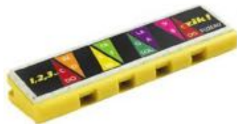
ARMÓNICA SOLA REF 195-71465

Armónica 4 agujeros - Hohner. Sintonizado en C, con un mecanismo de cobre, diseñado específicamente para el aprendizaje. Se coloca una pegatina con el código de color y el nombre de las notas en francés e inglés.