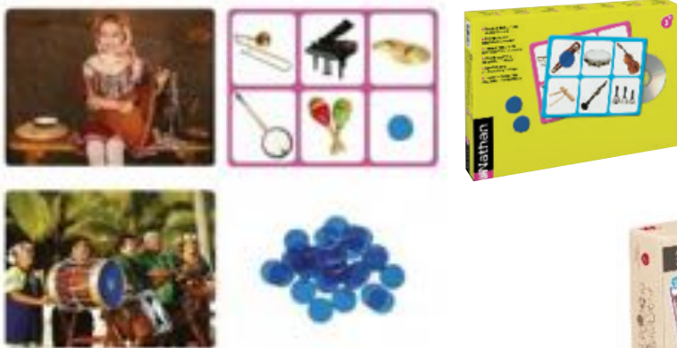
JUEGOS SONOROS DE LOS INSTRUMENTOS MUSICALES REF 77-337226

Para poner en práctica actividades relacionadas con el lenguaje oral, la escucha y el descubrimiento del mundo, con la temática de los instrumentos de música. Juego de lenguaje: observando las láminas de fotos, los niños aprenden a reconocer los distintos instrumentos, su familia, su material, su origen, sonido, etc. Además adquieren un léxico preciso. Juegos de bingo sonoro: varias actividades de dificultad progresiva sobre las 36 canciones distintas, con el fin de desarrollar la escucha, así como la discriminación y la memoria auditivas. Contiene: 1 CD de 40 minutos, 16 láminas de fotos de cartón, 6 láminas de bingo de cartón, 36 fichas de plástico y 1 guía didáctica. L/A de la lámina: 24x18 cm. Diámetro de las fichas 3,5 cm. A partir de 4 años.