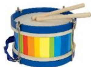
TAMBOR PIEL NATURAL REF 105-61919