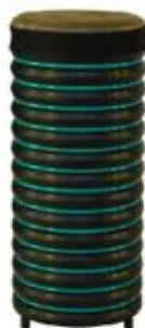
TAMBOR TROMMUS 52 X 22 CM REF 195-71353

El Tambor Oceanico (Ocean Drum) es un instrumento de percusión. La particularidad de este instrumento es que al hacer movimientos circulares reproduce el sonido del mar. Su forma es redonda como la del tambor, con estructura de madera y superficie de piel. En su interior tiene pequeñas esferas. El movimiento de estas esferas es lo que hace que produzca un sonido relajante que simula el oleaje. Medidas disponibles: 20, 25, 35, 40 cms.