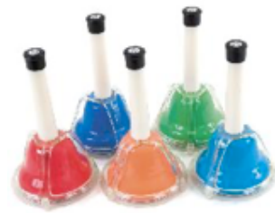
ALTERACIONES REF 195-70609

Está compuesto por 13 campanas afinadas, muy fáciles de manejar por lo que es ideal para niños más pequeños. Cada campana emite un sonido de gran calidad, que representa una nota musical. Los colores permiten reconocer las notas de la escala musical y tocar de forma fácil una melodía. Son doblemente divertidas porque emiten sonido bien sacudiéndolas, o bien golpeándolas. Incluye un total de 13 campanas: 8 campanas + 5 alteraciones. Afinadas en Do5 a Do6.