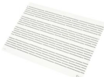
LAS MINI PIZARRAS REF 195-7535

Esta pizarra es un material pedagógico muy útil tanto para la clase de música como para cualquier otra asignatura. Por en anverso tiene grabado 6 pentagramas y el reverso es blanco liso para que puedas escribir lo que quieras. Puedes usar rotuladores de pizarra. Se borra en seco. Fabricada en PVC, es muy ligera y resistente. Sus medidas son 64,5 x 86 cm.