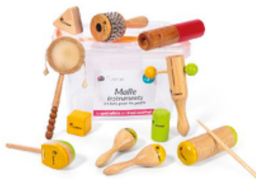
CAJA DE 10 INSTRUMENTOS DE MADERA REF 195-70963

Hablar y jugar con el lenguaje musical es una forma idónea de aprenderlo. Este juego incluye 30 tarjetas grandes con notas, pentagramas, claves y símbolos de silencio. Medidas: Tarjetas 12x17cm. Maletín 23,5x17,5x2x5cm