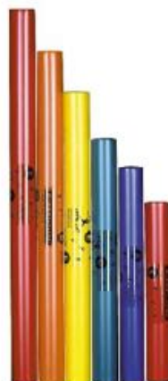
PENTATÓNICOS REF 195-3459

Compuesto por un lote de 8 tubos que recrean las notas Do, Re, Mi, Fa, Sol, La, Si, Do. Do4 a Do5. Medidas comprendidas desde 63 cm a 30 cm.