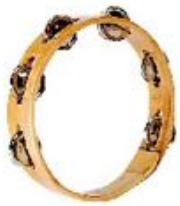
CORONAS DE CÍMBALOS REF 195-0582

Instrumento musical de sonido seco gracias a su esqueleto de madera de gran calidad. Es un formidable instrumento de iniciación musical. Medidas: L. 25 cm