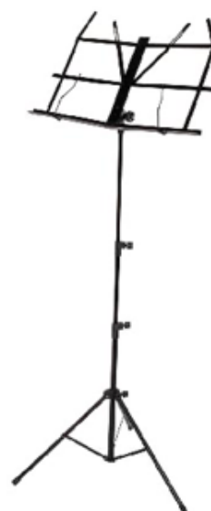
ATRIL DE METAL REF 195-8805

Esta pizarra es un material pedagógico muy útil tanto para la clase de música como para cualquier otra asignatura. Por en anverso tiene grabado 4 pentagramas y el reverso es blanco liso para que puedas escribir lo que quieras. Puedes usar rotuladores de pizarra. Se borra en seco. Fabricada en PVC, es muy ligera y resistente. Tamaño: 22 x 31 cm. Caben en la mochila escolar.