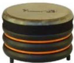
TAMBOR TROMMUS 19 X 28 CM REF 195-71351