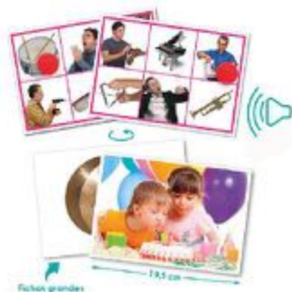
BINGO: ACCIONES E INSTRUMENTOS MUSICALES REF 13-20622

Juego de asociación con funcionamiento de bingo. Se busca reconocer la imagen y asociarla a los sonidos. Incluye CD con sonidos Bingo y guía pedagógica e instrucciones. Edad recomendada: De 3 a 8 años.