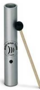
WAH WAH TUBE MINI REF 195-880069

Haz girar la maza dentro del golpeando cada una de las lamas de madera. Producirá un sonido melódico y melodioso. Ideal para los más pequeños, para que se inicien en el mundo de la música, de la percusión y del ritmo. Fabricadas en madera natural. Se suministra con maza. Medidas: A. 15 cm – Ø 10 cm.