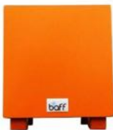
CAJÓN BAFF 38X26X26 CM NARANJA REF 195-71298

Golpeando la parte superior de la mesa frontal, obtienes tonos altos y si bajas hacia el centro, tonos bajos. Cajones reales en formato "Niños". Adaptados al tamaño de los niños de 4 a 9 años, estos instrumentos permitirán una práctica rítmica colectiva real. Peso: 2,6 kg.