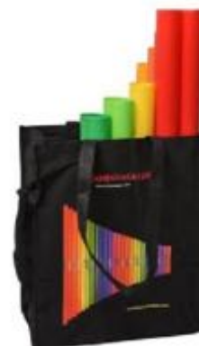
BOLSA PARA BOOMWHACKERS REF 195-71372

Se adapta a una extremidad del tubo para conseguir una octava inferior.