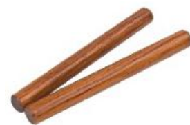
CLAVES PAO ROSE REF 195-70789

Es muy fácil de tocar, sólo hay que hacer girar el instrumento y emitirá un sonido seco y agudo. Fabricado en madera. Medidas: L. 13 cm – Alt. 13 cm