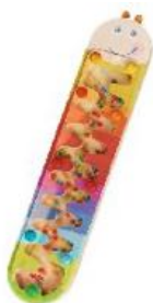
PALO DE LLUVIA GUSANO REF 57-302593

Palo de lluvia para estimular los sentidos. Con forma de gusano de madera. Tamaño: 27 x 7 cm. Edad recomendada: A partir de 2 años.