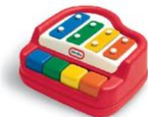
BABY PIANO REF 24-61227