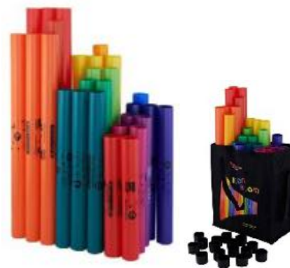
LOTE 28 BOOMWHACKERS REF 195-78034

Contiene: 3 tubos en C, 1 tubo en C, 3 tubos en D, 1 tubo en Re, 3 tubos en E, 2 tubos en F, 2 tubos en F, 3 tubos en G, 1 tubo en Sol, 3 tubos en A, 2 tubos en Sib, 2 tubos en B, 2 tubos en C, 2 16 octavas. Bolsa de transporte incluida.