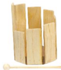
OCTOBLOCK REF 195-9338

Colocarlos contra los dientes abiertos (no morderlo). Poner ligeramente los labios sobre el birimbao y mover la lama con vuestro dedo índice. Es la respiración y los movimientos de la lengua los que darán los sonidos melódicos. Tamaño : L. 8 cm