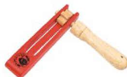
CARRACAS REF 195-70775

Instrumento perfecto para desarrollar el ritmo, la coordinación, la concentración y la inteligencia musical. – Medidas: 13,5 cm largo. Incluye dos maracas.