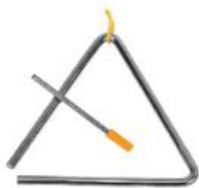
TRIÁNGULO 13 CM REF 195-8267 16 CM REF 195-8268 19 CM REF 195-8269

Sencillo de tocar por lo que es perfecto para la iniciación y el desarrollo del sentido del ritmo. Fabricado en acero brillante. Incluye el martillo. Disponible en 3 tamaños: 13, 16 y 19 cm.