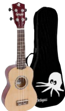
UKELELE REF 195-71168

Armónica 4 agujeros - Hohner. Sintonizado en C, con un mecanismo de cobre, diseñado específicamente para el aprendizaje. Se coloca una pegatina con el código de color y el nombre de las notas en francés e inglés.