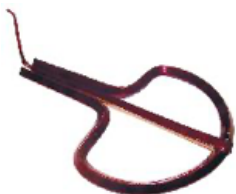
BIRIMBAO REF 195-4996

Al agitar el instrumento, este collar choca sobre la superficie de la madera, produciendo un particular sonido. Se sacude girando la muñeca y se obtiene un sonido suave y armonioso. Fabricado en madera natural. Medidas: L. 13 cm – Ø 5,5 cm