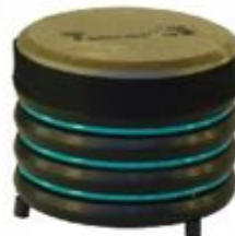
TAMBOR TROMMUS 19 X 22 CM REF 195-71350