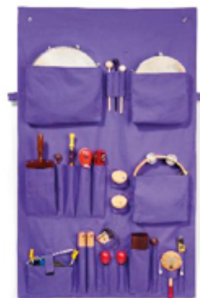
ESTUCHE-MALETA + 17 INSTRUMENTOS REF 195-7481

Herramienta de escucha activa de música en clase. Los niños escuchan una pieza musical, luego expresan lo que han percibido y sentido utilizando una selección de imágenes magnéticas. Contenido: 1 póster ilustrado (60 x 75 cm). 40 tarjetas magnéticas que incluyen 25 tarjetas con símbolos y 15 fotos de instrumentos musicales (8 x 8 cm). 1 guía didáctica de 8 páginas incluyendo 1 póster "Escucho" para fotocopiar (21 x 26 cm). 1 CD (26 min.) con 11 piezas o extractos de música clásica y del mundo.