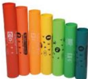
BOOMWHACKERS PEQUEÑOS REF 195-71409

Compuesto por un total de 8 piezas con tesitura carrillón contralto: Do4 a Do5. Están montadas sobre tubos de plástico (tipo "Boomwhackers") para una mayor resonancia y una excelente calidad sonora. Incluye 8 mazas para tocar. Se suministra en una maleta de plástico fácil de transportar. Medidas de la maleta: 43x30x8 cm.