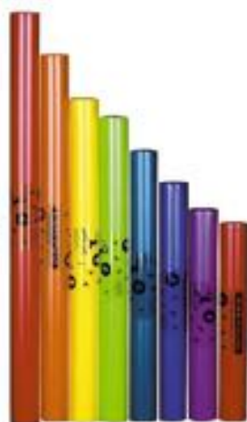
DIATÓNICOS CONTRALTO REF 195-3460

Compuesto por un lote de 5 tubos que recrean las notas Do #, Mi b, Fa #, Sol #, Si b. Afinado en Do#3 a Si b3. Medidas comprendidas desde 125 cm a 63 cm.