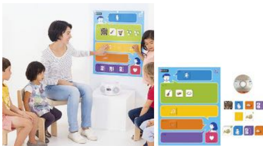
TALLER DE ESCUCHA MUSICAL Y DE EXPRESIÓN REF 77-388443

Juego de asociación con funcionamiento de bingo. Se busca reconocer la imagen y asociarla a los sonidos. Incluye CD con sonidos Bingo y guía pedagógica e instrucciones. Edad recomendada: De 3 a 8 años.