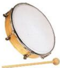
TAMBORIL DE PIEL SINTÉTICA SIN CÍMBALOS

Sólo hay que golpear una con la otra. Fabricada en madera. Medidas: L. 15 cm – Ø 1,5 cm