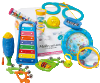
COFRE MINI-MELOMANO 16 INSTRUMENTOS REF 195-2968

Selección de 16 instrumentos para crear sesiones de actividades musicales donde cada niño escogerá su instrumento. Los colores y ritmos animarán la clase. A partir de 3 años. Medidas del cofre : A. 38,5 cm – P. 28 cm – Alt. 24 cm.