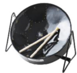
STEEL DRUM REF 195-3666

El tubo wah wah es una campana tubular de aluminio. Proporciona un sonido modular duradero y agudo al abrir y cerrar el puerto lateral. Se suministra con un mazo