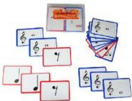
MAXI MEMORY MÚSICA REF 12-980

Estuche-maleta con capacidad para 17 instrumentos (Incluidos) puedes ordenar y organizar todos tus instrumentos. Con compartimentos de distintos tamaños. Puedes colocarlo en el pared del aula o de casa, o doblarlo y llevarlo donde quieras. Fabricado en tela Medidas: 112 x 66 cm.