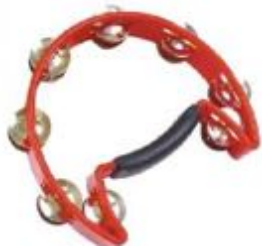
CORONA DE CÍMBALOS REF 195-70909

Fabricadas en madera. Pintadas a mano. Set de 2 Maracas. Medidas: 20 cm largo.