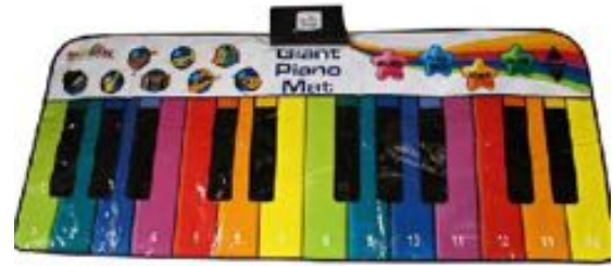
PIANO GIGANTE ROLL UP REF 195-78082

Teclado de piano gigante y flexible. Ideal para tocar con los pies. Dimensión lúdica y coreográfica – Pilas no incluidas. Dimensiones : 175 x 75 cm. Recomendado a partir de 4 años.