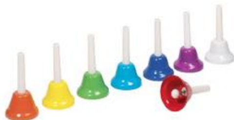
JUEGO DE CAMPANAS REF 105-61951

8 campanas afinadas en notas de Do5 a Do6. Gracias a los colores, encuentra fácilmente las notas y se inicia poco a poco en la música. Son doblemente divertidas porque emiten sonido bien sacudiéndolas, o bien golpeándolas.