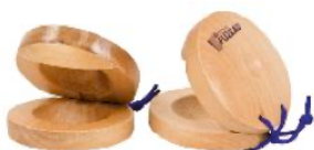
CASTAÑUELAS DE DEDO REF 195-8275

8 notas de Do5 a Do6. Gracias a los colores, encuentra fácilmente las notas y se inicia poco a poco en la música. 8 laminas de colores afinadas del Do5 a Do6 (gama diatónica) con notas grabadas. 2 mazas. 1 maletín de almacenaje de plástico transparente