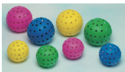
PELOTA PERFORADA CON CASCABEL