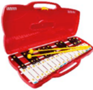
PIANOT REF 195-9878

Teclado de piano gigante y flexible. Ideal para tocar con los pies. Dimensión lúdica y coreográfica – Pilas no incluidas. Dimensiones : 175 x 75 cm. Recomendado a partir de 4 años.