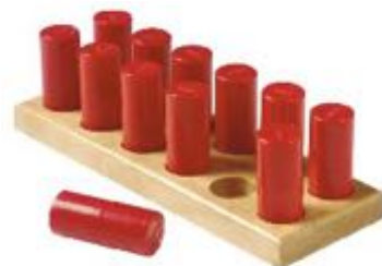
TUBOS SONOROS REF 195-71191

Percunot se compone de 8 tubos. Cada tubo está equipado con un mazo. Sólo hay que agitarla por el mango y el mazo la golpea. Cada nota está coloreada de acuerdo a la codificación de los boomwhackers, juegos de campanas, mini-metalonotas... Recomendado a partir de 8 años.