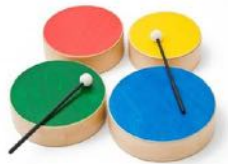
SET DE 4 TAMBORES REF 195-71187

Conjunto de 4 tambores con superficies de madera pintadas. Se utilizan como tambores manuales o de mesa (con el mazo). Este conjunto es ideal para la práctica rítmica colectiva. Promueve el juego de roles y que todos se den cuenta del lugar del otro. Los colores corresponden a un diámetro diferente. Dimensiones: Amarillo Ø 16 cm Rojo Ø 18 cm Verde Ø 20 cm Azul Ø 22 cm. Los sonidos obtenidos son por lo tanto variados. Se suministra con 2 mazos.