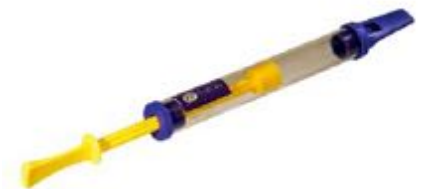
FLAUTA DE ÉMBOLO REF 195-2552

Fabricada en plástico de gran calidad. Consta de 3 partes y se presenta en un estuche, que es muy cómodo para poder guardarla. Digitación moderna. Medida: aproximadamente 32 cm.