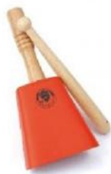
CAMPANA DE MANO REF 195-71048

Cada una de las campanas afinadas emite un sonido distinto que corresponde a una nota y que podrás relacionar con su color. Es ideal para completar el juego diatónico. Este set está compuesto por 5 campanas. Afinadas Do5 a Do6.