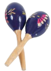
MARACAS 20 CM. REF 195-1413

Instrumento con forma de silbato, tradicional de Brasil, muy característico de la samba. Se usa como instrumento de ritmo. Medidas: 4 x 7,5 cm.