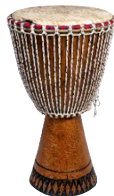
DJEMBÉ GRANDE REF 195-9386