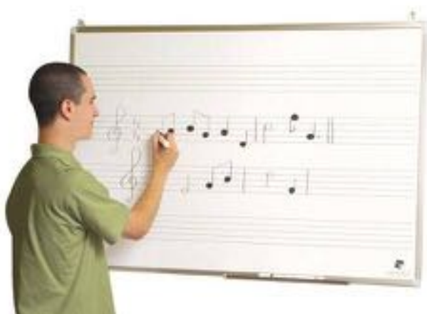
PIZARRA PARA ENSEÑANZA MUSICAL REF 195-8400

Pizarra musical pautada cuya parte trasera se adhiere sobre cualquier superficie plana. Se puede quitar y poner las veces que sea necesario, con la tranquilidad de que no deja residuo, al ser removible y reutilizable. Incluye 85 figuras musicales magnéticas para crear composiciones sobre el pentagrama. Permite la escritura con un rotulador borrable (no incluido). 1 Pizarra pautada removible, 85 figuras musicales magnéticas y 1 folleto. Medidas: 120x30 cm. Recomendado de 3 a 6 años.