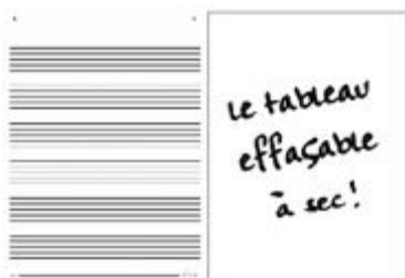
TABLERO PARA ENSEÑANZA MUSICAL REF 195-7534

Esta pizarra es perfecta para el aula de música. Tiene 4 pentagramas indelebles. Con marco de aluminio de 3 cm. Se pinta con rotuladores borrrables en seco. Medidas: 120 x 80 cm. (pie vendido por separado).