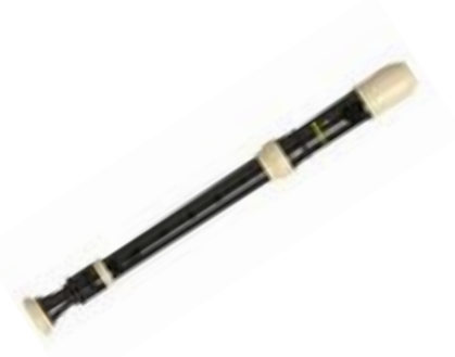
FLAUTA SOPRANO MODERNA REF 195-8265

El Ukelele es un instrumento musical parecido a la guitarra pero de menor tamaño y con cuatro cuerdas. Las cuerdas de este ukelele soprano son Aquila Nylgut, lo que hace que suene mejor, con un sonido limpio, potente y rico en matices. Fabricado en madera de color natural. Se suministra con una funda para poder guardar y que quede protegido. Tamaño : Largo 54,5 cm, Ancho 20 cm, Grosor 7 cm