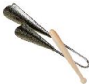
CAMPANA BRASILEÑA REF 195-8296

Instrumento de percusión fabricado en madera natural. Incluye maza. Medidas: 13 x 5 x 3 cm.