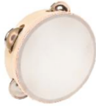
PANDERETA PIEL FIBRA SINTÉTICA REF 195-70794

Esta pandereta está compuesta por 8 pares de címbalos. Fabricada con piel natural, muy resistente.