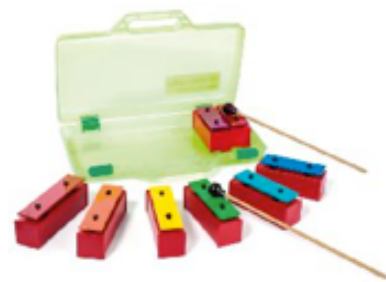
MINI-METALNOTAS REF 195-8288

Campana característica de la música brasileña, usada en el ritmo de la samba. Metálica. Emite un sonido característico al ser golpeada con una baqueta. Medidas aproximadas: 30 x 13 cm.