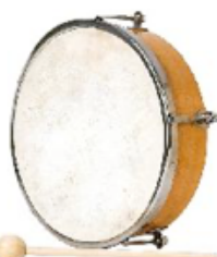
TAMBORIL DE PIEL NATURAL SIN CÍMBALOS 20 CM REF 195-0571

Instrumento fabricado en madera y piel sintética. Muy fácil de tocar, sólo golpear con la maza a ritmo. La piel se puede tensionar apretando los tornillos. Se suministra con una maza.