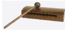
CAJA CHINA PAO ROSA REF 195-0635

Compuesta por 4 pares de platinillos pequeños. Fabricada con fibra sintética, muy resistente y fácil de lavar. Tiene un diámetro de 15 cm.