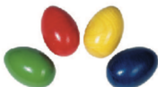
MARACAS HUEVO REF 105-UC102