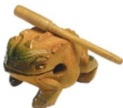
RANA GÜIRO 10 CM REF 195-9222

El sistro es un instrumento muy antiguo que ya usaban los egipcios. Considerado un instrumento de percusión de la familia de los idiófonos, en la gama de los indirectamente percutidos, o sacudidos, como las maracas, las castañuelas o los cascabeles. Este modelo está fabricado en PVC y tiene un total de 12 címbalos metálicos. Medidas: 33 cm (L).