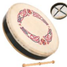
BODHRAN REF 195-9299

Fabricado en madera y piel natural. No tiene címbalos alrededor del aro de madera. Muy fácil de tocar, sólo golpear con la maza a ritmo. Incluye la maza. Cuenta con 9 tuercas para tensionar la piel.