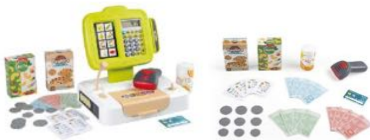
CAJA REGISTRADORA REF 134-350113

Fácil de montar. Incluye más de 40 accesorios realistas para ir de compras, como un escáner manual, 6 monedas, 30 billetes, una tarjeta de débito, 3 pantallas de pago, una manzana, un plátano y una zanahoria. Dimensiones: 42x20x35 cm. Peso: 1,65 kg. A partir de 2 años.