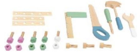
BANCO DE TRABAJO REF 175-11376