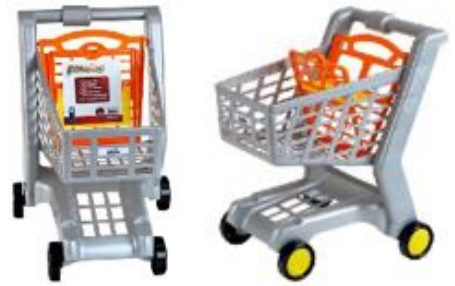
CARRITO DE SUPERMERCADO REF 27-9690

Set de 4 cestas de la compra de colores variados (púrpura, verde, naranja y azul). Son apilables. Tamaño: 18 cm de longitud y 10 cm de altura. Edad recomendada a partir de 18 meses.