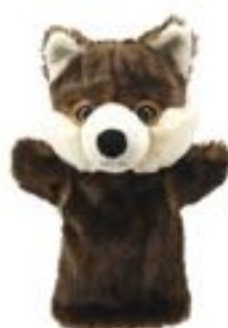
TÍTERE LOBO REF 311-PC004630

Marioneta adecuada para niños a partir de 18 meses.