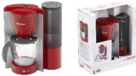
CAFETERA AUTOMÁTICA REF 27-9577

La cafetera y el filtro están hechos de plástico de gran calidad, son fáciles de limpiar, seguros para los niños y listos para utilizarse en cualquier momento. Dimensiones: 16x20x9 cm. Recomendado a partir de 3 años.