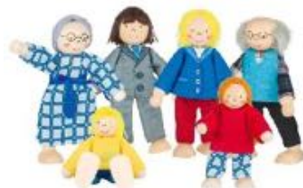
MUÑECOS ARTICULADOS FAMILIA CIUDAD REF 105-SO218

Esta pandilla de muñecos flexibles fomenta el juego simbólico y la imaginación. Con extremidades articuladas, pueden adoptar diversas posturas como estar de pie o sentarse. Hechos de madera y textil, son ideales para complementar casas de muñecas y estimular el juego creativo, la empatía y la expresión emocional. Incluye 4 muñecos de 6 cm cada uno. Edad recomendada: a partir de 3 años.