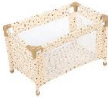
CUNA DE VIAJE MUÑECAS REF 59-65173

Fabricada en madera de haya, diseñada para que las muñecas descansen cómodamente. Medidas: 60 x 29 x 25 cm. (No incluye ropa de cama). Edad recomendada: a partir de 3 años.