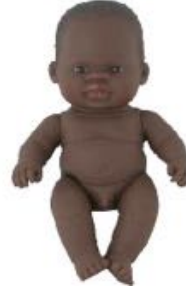
AFRICANO REF 1-31143