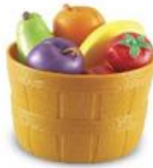
CESTA DE FRUTAS REF 137-LER9720

Set de 10 piezas de vegetales y verduras en una cesta. Fabricados en plástico resistente y con colores vivos. Incluye: Cesta y 9 vegetales (espárrago, berenjena, brócoli, zanahoria, maíz, pepino, pimlento rojo, pimlento amarillo y patata. La verdura más larga, la patata, mide 7 cm de largo. Edad recomendada: de 18 meses a 6 años.