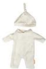
PIJAMA BEIGE CON GORRO REF 1-31583

Conjunto de ropa para muñecos de hasta 38 cm, perfecto para fomentar el juego simbólico y el cuidado. Incluye pijamas, conjuntos de verano e invierno, todos hechos con materiales reciclados y con un diseño artesanal. Estos conjuntos permiten a los peques desarrollar su creatividad e imaginación mientras recrean diferentes momentos y rutinas cotidianas. Recomendado a partir de 9 meses.