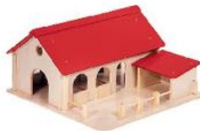
LA GRANJA REF 77-371063

Granja de madera con accesorios. Gran tamaño. Incluye 71 animales y accesorios de madera. Tamaño del establo: 19,9 x 13,5 x 14,5 cm. Recomendado a partir de 3 años.