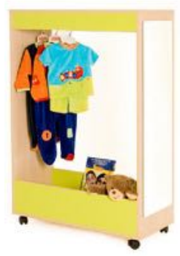
MUEBLE DE DISFRACES ABIERTO REF 40-602002

Medidas: 90x40x132 cm. El mueble dispone de un espejo de seguridad en uno de sus laterales y barra central con sistema anticaída para colgar los disfraces.