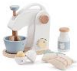
BATIDORA REF 318-1000260