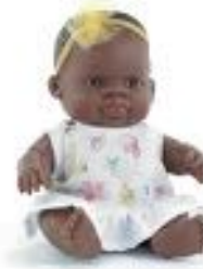
BABY AFRICANA NIÑA CON ROPA REF 1-33003