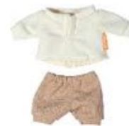
CAMISETA Y PANTALÓN ENTRETIEMPO REF 1-31575