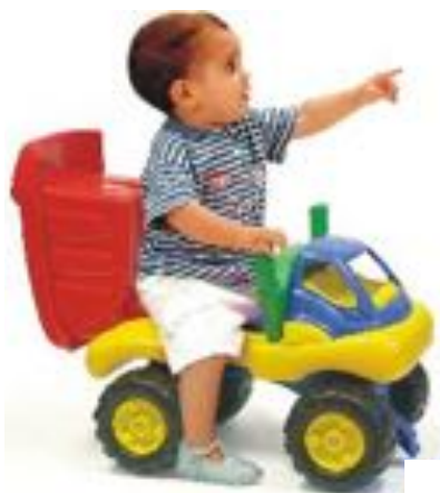
MONSTER TRUCK REF 1-45151

Camión de bomberos ecológico, duradero y hecho de recursos renovables, fabricada 100% con biobase de caña de azúcar. Tamaño: 28 cm. Recomendado a partir de 1 año.