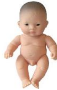
ASIÁTICO REF 1-31145