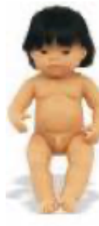
ASIÁTICO REF 1-31055