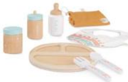
SET ALIMENTACIÓN MADERA MUÑECOS REF 1-94060

Bañera de bebé fabricada con bioplástico procedente de la caña de azúcar, para bañar a los muñecos y muñecas Miniland dolls de hasta 40cm. Incorpora una esponjita con forma de arcoíris para completar el baño. Ancho de la bañera 42cm. Recomendado a partir de 3 años.