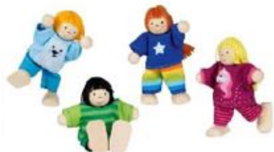
MUÑECOS FLEXIBLES NIÑOS REF 105-51499

Esta pandilla de muñecos flexibles fomenta el juego simbólico y la imaginación. Con extremidades articuladas, pueden adoptar diversas posturas como estar de pie o sentarse. Hechos de madera y textil, son ideales para complementar casas de muñecas y estimular el juego creativo, la empatía y la expresión emocional. Incluye 4 muñecos de 6 cm cada uno. Edad recomendada: a partir de 3 años.