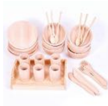
SET DE TÈ DE MADERA REF 328-33400

Los niños pueden jugar a sus anchas con nuestro juego de té de madera natural. El set incluye 6 ud de cada pieza: platos, cuencos, tazas, cuchillos, tenedores y cucharas. Recomendado a partir de 3 años.