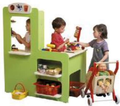
LA TIENDA REF 77-372877

Mostrador y supermercado al mismo tiempo, la tienda representa cualquier tipo de comercio y permite que los niños recreen numerosas situaciones de intercambio. Su estructura angulosa delimita claramente dos espacios de juego, el interior y el exterior. Además la exposición de los alimentos en estantes o cestas (se venden por separado) facilita su posterior colocación. Incluye un tapete con rodillos de madera maciza, cuyo soporte debe fijarse al mostrador. Panel de partículas, superficie de melamina verde y en color abedul, con grosor de 15 mm. esquinas protegidas y ángulos redondeados. Tamaño: 100x86x120 cm. Altura del mostrador: 60 cm. Debe montarse. No es conveniente para niños menores de 3 años.