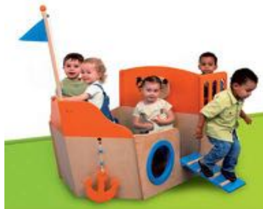
BARCO REF 77-370981

Un gran barco en colores vivos muy equipado, 2 barreras con ruedas, 1 brújula serigrafiada, 1 ancla, 1 cofre con tirador, 1 pasarela móvil, 2 ventanillas una de ellas cerrada con plexiglás y 1 mástil con su bandera. En madera contrachapada 18 mm, barnizada incolora y lacada azul y naranja. Una portilla cerrada por un plexiglás transparente. Dimensiones 156x78x95 cm. Con mástil altura 135 cm. Caida de la pasarela: 31 cm sobre el ancho.