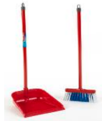
ESCOBA Y RECOGEDOR REF 27-6744

Altura 52,7cm. Recomendado a partir de 3 años.