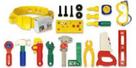
CAJA 19 HERRAMIENTAS REF 1-97003

Set de herramientas de juguete hechas de plástico suave y duradero. Incluye: martillo, destornillador, llave inglesa, taladro (con efectos de sonido) y caja de herramientas. Recomendado de 2 a 4 años.