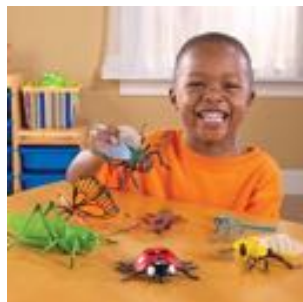
INSECTOS JUMBO REF 137-0789

Conjunto de 7 insectos de gran tamaño. Fabricados en plástico de gran calidad. Medidas de la mariposa: 20x13 cm