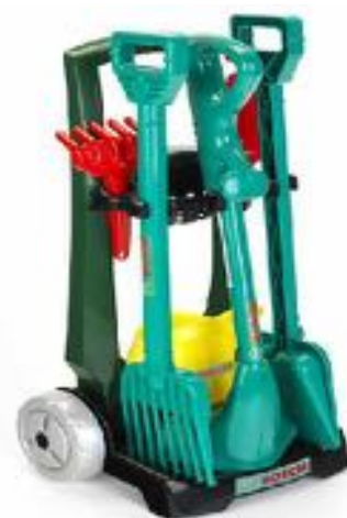
CARRO DE JARDINERÍA REF 27-2751

Carrito de jardín de 7 piezas Bosch. Incluye una podadora, una pala grande, un rastrillo, una regadera, una pala pequeña y un rastrillo de arena.