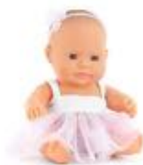
BABY EUROPEA NIÑA CON ROPA REF 1-33001