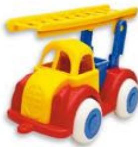
CAMIÓN DE BOMBEROS FIRE TRUCK REF 180-21211

Con tope antivuelco delantero y trasero. Dimensiones: 54x34x45 cm.