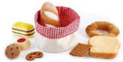
CESTA DE PAN REF 92-3168

Set de piezas de frutas en una cesta. Fabricados en plástico resistente y con colores vivos. Incluye: cesta y frutas (manzana, fresa, limón, plátano, ciruela, naranja, albaricoque, uva y pera). La cesta mide 21 x 14 cm. La fruta más larga, la pera, mide 8 cm de largo. Edad recomendada: de 18 meses a 6 años.