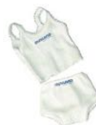
CONJUNTO CAMISETA Y BRAGUITAS REF 1-31520