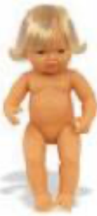
EUROPEA REF 1-31052