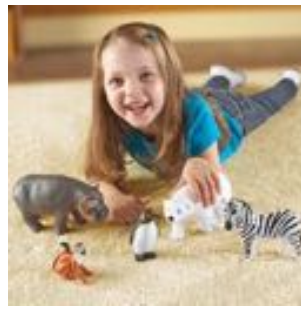
ANIMALES DEL ZOO JUMBO REF 137-0788

Conjunto de 5 animales del zoo de gran tamaño. Fabricados en plástico de gran calidad. Medidas del hipopótamo: 19,5x10 cm