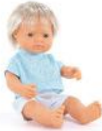
MUÑECO EUROPEO RUBIO CON ROPA REF 1-33201

Muñecos de 38 cm diseñados para fomentar el juego simbólico, el cuidado y el desarrollo emocional de los más pequeños. Cada muñeco, articulado y anatómicamente correcto, incluye actividades creativas como pulseras de la amistad personalizables y tarjetas para regalar, lo que permite a los niños explorar valores como la amistad, la generosidad y el compartir. Hechos de vinilo suave con un delicado aroma a vainilla, estos muñecos son perfectos para estimular la imaginación, la creatividad y las habilidades motoras finas. Recomendados a partir de 10 meses.