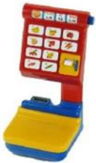
BALANZA ELECTRÓNICA REF 27-9315

Carrito de la compra de plástico resistente con ruedas de giro libre y asa extraíble, ideal para juegos de rol. Perfecto para transportar alimentos de juguete, peluches o coches pequeños, fomentando la imaginación y habilidades sociales. Dimensiones: 30 cm x 28,6 cm x 53,2 cm. Edad recomendada: a partir de 3 años.