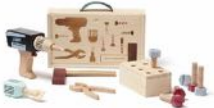
MALETIN DE HERRAMIENTAS REF 318-1000608

Maletín que incluye 12 accesorios de belleza relacionados con el pelo. El secador reproduce el sonido real. Pilas no incluidas.