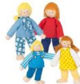
MUÑECOS ARTICULADOS FAMILIA JOVEN REF 105-51955

Los muñecos articulados son muy flexibles. Pueden sentarse, ponerse de pie... Incluye 6 muñecos. Representando una familia completa: 2 abuelos, 2 papás y 2 niños. Adecuados para todas las casas de muñecas Goki. Tamaño: 12 - 7 cm. Recomendado a partir de 3 años.