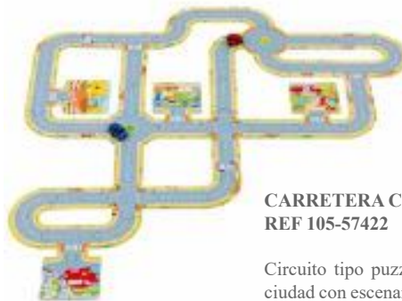
CARRETERA CON 2 VEHICULOS REF 105-57422

24 segmentos de carretera. Carretera de juguete flexible y duradera. 376 cm de longitud 12 curvas, 8 rectas, 2 intersecciones y 2 rotondas. Recomendado a partir de 3 años.