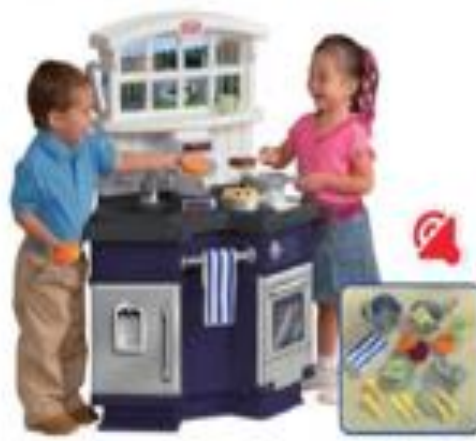
COCINA DOBLE LADO REF 24-1714

Conjunto de cocina compacto que incorpora horno, microondas, frigorífico, cocina, fregadero, armario... Además viene con 14 accesorios. Con sonidos que simulan el ruido al cocinar. Dimensiones: 112,5x60,5x62 cm.