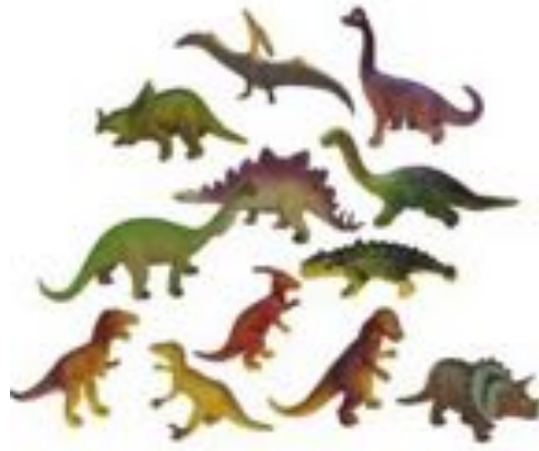
DINOSAURIOS 12 FIGURAS REF 1-25610