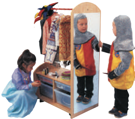
MUEBLE COMPACTO PARA DISFRACES REF 77-371229

Mueble compacto para disfrazarse y maquillarse, fijo o móvil gracias a sus ruedecitas. Equipado con un espejo de pie de plexiglás irrompible, una barra para colgar la ropa y 4 cajones de plástico transparente. De madera melaminada color haya. Dimensiones: 70x55x124 cm.