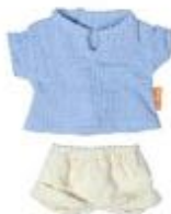
CAMISETA Y PANTALÓN CALOR REF 1-31579