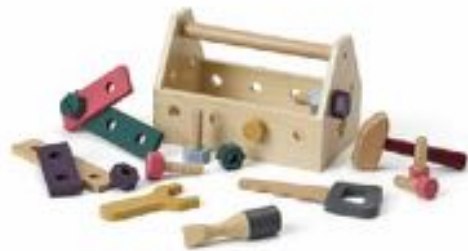
CAJA DE HERRAMIENTAS REF 318-1000610