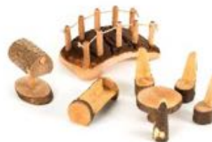
MOBILIARIO DEL BOSQUE REF 234-EY07256

Un conjunto de figuras sencillas de madera. Añade a estas figuras fotografías de niños del colegio para que el juego de los niños resulte más familiar, o incluye fotos de profesionales para fomentar el conocimiento. También podrás utilizar pinturas para crear tus propios personajes para tu minimundo, o incluso utilizar abalorios como plumas o lentejuelas para llevar tus creaciones a un nivel superior. Incluye: 20 figuras de madera. Altura 9 cm. Recomendado a partir de 3 años.