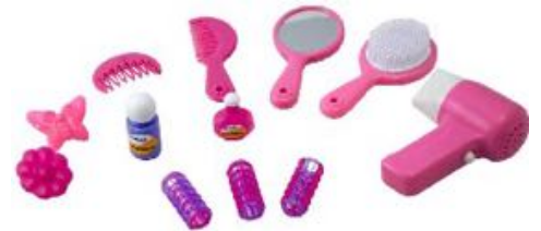
MINI BEAUTY REF 1-97006

Maletín que incluye 12 accesorios de belleza relacionados con el pelo. El secador reproduce el sonido real. Pilas no incluidas.