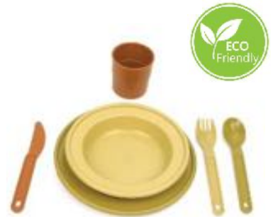
VAJILLA BIO 4 COMENSALES REF 180-20-81404SP

48 piezas de plástico. 6 elementos diferentes en 4 colores. Cada color se duplica. En plástico muy resistente. Ø plato llano: 19 cm; Ø plato hondo: 18 cm; altura vaso: 8 cm; longitud cubiertos: 13,5 cm.