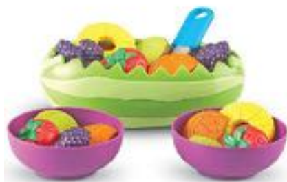
SET DE ENSALADA DE FRUTAS FRESCAS REF 137-LER9268

Los niños pueden jugar a sus anchas con nuestro juego de té de madera natural. El set incluye 6 ud de cada pieza: platos, cuencos, tazas, cuchillos, tenedores y cucharas. Recomendado a partir de 3 años.