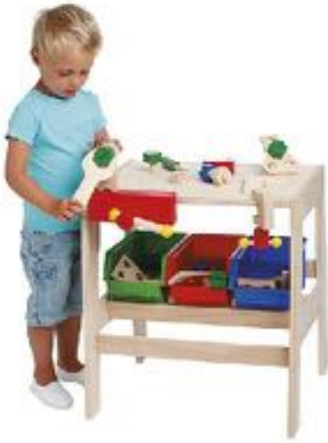
BANCO DE CARPINTERO REF 77-345450

Un banco de carpintero con numerosas herramientas: 1 abrazadera, 1 tornillo de banco, 1 llave, 1 martillo, 1 destornillador, 1 escuadra, tornillos, cuñas, tablillas de 5 formas o tamaños diferentes. Fabricado en madera. Robusto y estable. Madera natural Barnizada. Incluye 3 cajas de plástico de 3 colores para colocar los diferentes accesorios. (44 accesorios en total). Tamaño: 50x35x54 cm.. Recomendado a partir de 3 años.