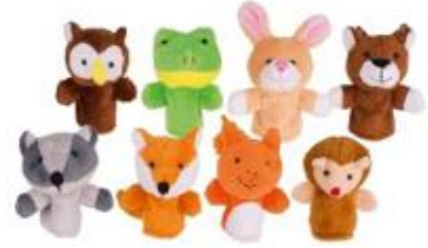
MARIONETAS DE DEDO ANIMALES BOSQUE REF 105-50962

Se suministran sin el soporte de madera.