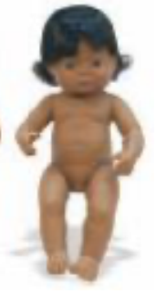
LATINO AMERICANA REF 1-31058