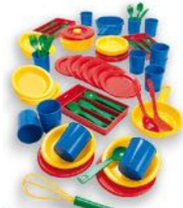
VAJILLA 82 PCS REF 60-16952

Este set incluye: tazas, maquina de hacer café, termo, tostador, platos y cubiertos (2 tenedores, 2 cucharas, 2 cuchillos y 2 cucharillas del café) Medidas: 44 x 12 x 35 cm. Edad recomendada: A partir de los 3 años.