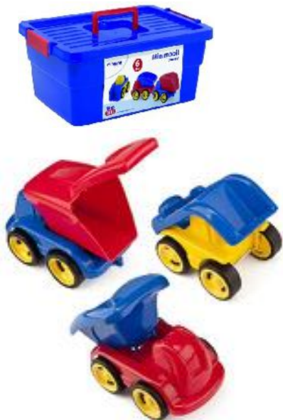
MINIMOVIL DUMPY CONTENEDOR 6 UDS REF 1-27469

Fabricados en plástico flexible y robusto a la vez. Ruedas muy seguras no extraíbles. Incluye 2 volquetes, 2 excavadoras y 2 camiones de reciclaje. Dimensiones de los vehículos: 18 cm.