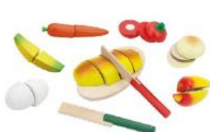
COMIDAS PARA CORTAR REF 60-16219A

Conjunto de 5 alimentos de madera. 2 mitades unidas por un sistema de velcro muy resistente. Corta con el cuchillo y la fruta estará partida por la mitad. El niño adquirirá la destreza necesaria para utilizar el cuchillo. Edad Recomendada: A partir de 3 años.