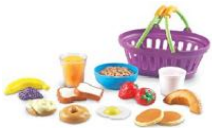
SET DE DESAYUNO REF 137-LER9730

Incluye trozos de huevo, aguacate, pepino, tomate, cebolla y otras verduras que pueden trocearse usando el cuchillo de juego realista. ¡También incluye un bol para ensalada, una cuchara, un tenedor y dos botellas de aderezo!. A partir de 3 años.