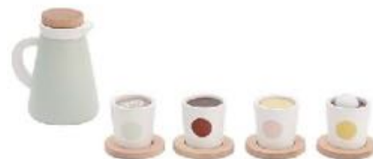
JUEGO DE CAFE REF 318-1000270