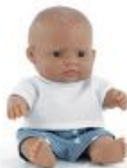
BABY LATINO NIÑO CON ROPA REF 1-33005