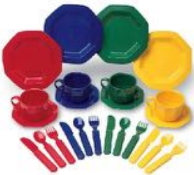
SET DE MENAJE 24 PIEZAS REF 137-LER0294

Set de servicio para 4 niños con 24 piezas en total. Conjunto de vajilla fabricada 100% con biobase de caña de azúcar. Tamaño: 18 cm de diámetro los platos llanos. Recomendado a partir de 1 año.