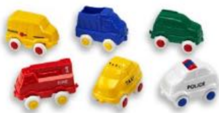
CUBO VEHÍCULOS PROFESIONES 15 PIEZAS REF 180-241052

Fabricados en plástico flexible y robusto a la vez, y con ruedas muy seguras, no extraíbles, y ejes de alta resistencia. 1 contenedor de 10 piezas: 1 formula, 1 coche, 1 pick up, 1 tractor, 1 coche de policía, 1 volquete, 1 grúa, 1 excavadora, 1 ambulancia y 1 coche de bomberos. Medida: 12 cm. Recomendado de 18 meses a 3 años.