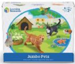
MASCOTAS JUMBO REF 137-0688

Conjunto de 6 mascotas de gran tamaño. Fabricados en plástico de gran calidad. Medidas del perro: 20x15 cm.