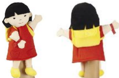
MARIONETA KIM REF 77-352498

Fabricado en poliéster y terciopelo de algodón, lavable a máquina a 30 °C. Dejar secar lentamente a temperatura ambiente. Altura: 32 cm.