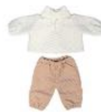
JERSEY Y PANTALÓN ENTRETIEMPO REF 1-31587