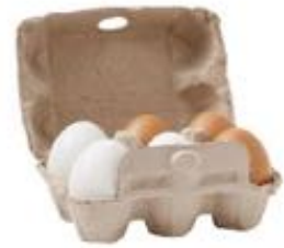
6 HUEVOS DE MADERA REF 318-1000361

Juego de ingredientes necesarios para crear cupcakes divertidos y originales.