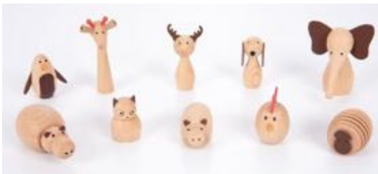
SET ANIMALES MADERA 4X7 CM 10 UDS REF 232-73472

10 conos grandes que miden 22x20x19 cm. 10 conos pequeños que miden 14x14x13 cm. 4 colores en diferentes tonos de marrón.