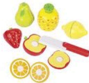
FRUTA CON VELCRO REF 105-51597

Conjunto de 5 verduras de madera. 2 mitades unidas por un sistema de velcro muy resistente. Corta con el cuchillo y la fruta estará partida por la mitad. El niño adquirirá la destreza necesaria para utilizar el cuchillo. Edad Recomendada: A partir de 3 años.