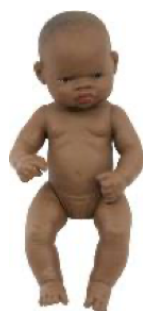
AFRICANA REF 1-31034