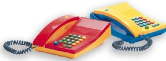
TELÉFONO REF 60-16113

Medidas: 33 x 65 x 49,5 cm. A partir de los 5 años.