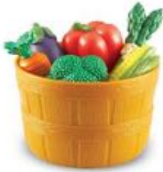
CESTA DE VEGETALES REF 137-LER9721

Set de 10 piezas de vegetales y verduras en una cesta. Fabricados en plástico resistente y con colores vivos. Incluye: Cesta y 9 vegetales (espárrago, berenjena, brócoli, zanahoria, maíz, pepino, pimlento rojo, pimlento amarillo y patata. La verdura más larga, la patata, mide 7 cm de largo. Edad recomendada: de 18 meses a 6 años.