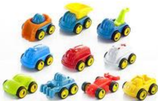
MINIMOBIL GO&JOB 12 CM 10 UDS REF 1-27487

Fabricados en plástico flexible y robusto a la vez, y con ruedas muy seguras, no extraíbles, y ejes de alta resistencia. 1 contenedor de 10 piezas: 1 formula, 1 coche, 1 pick up, 1 tractor, 1 coche de policía, 1 volquete, 1 grúa, 1 excavadora, 1 ambulancia y 1 coche de bomberos. Medida: 12 cm. Recomendado de 18 meses a 3 años.