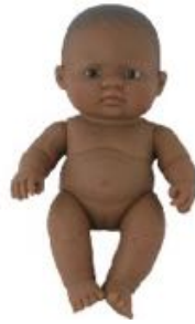
LATINO AMERICANA REF 1-31148