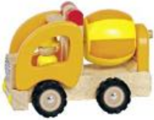
HORMIGONERA REF 105-55926

Hormigonera de juguete fabricada en madera maciza y con neumáticos de goma. Tamaño: 17x10x12 cm. Recomendado partir de 2 años.