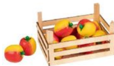
MANZANAS EN CAJA DE MADERA REF 105-51665

Caja de frutas y verduras. Ideal para equipar el puesto de mercado. Incluye piezas de fruta y verdura. Caja: 14x10x7,3 cm. Recomendado a partir de 3 años.