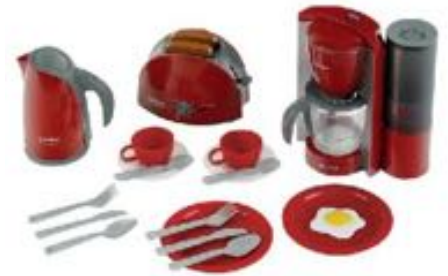
SET DE DESAYUNO BOSCH REF 27-9564

La cafetera y el filtro están hechos de plástico de gran calidad, son fáciles de limpiar, seguros para los niños y listos para utilizarse en cualquier momento. Dimensiones: 16x20x9 cm. Recomendado a partir de 3 años.