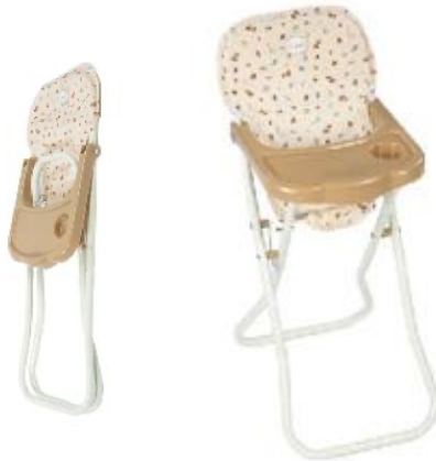
TRONA DE MUÑECAS REF 59-65171

Trona plegable con estampado vichy. Los materiales son de calidad y estructura de metal. Los peques podrán sentar a sus muñecos para darles de comer. El muñeco que puede ponerse en la trona puede medir entre 36 y 52 cm. Tela fácilmente removible para poder lavar a máquina. Medidas: Altura 27cm, Ancho 61cm. Recomendado a partir de 2 años.