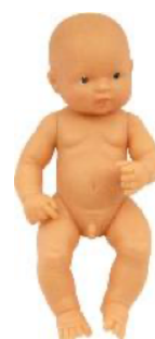
EUROPEO REF 1-31031