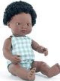
MUÑECO AFRICANO CON ROPA REF 1-33205