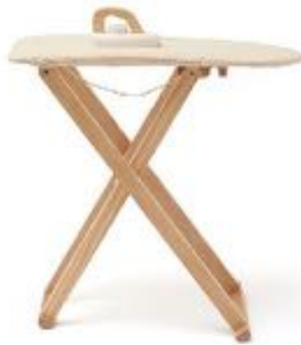
TABLA DE PLANCHAR REF 318-1000557

Set de planchado Bosch con tabla de planchar y plancha. Se puede regular la altura de 47 a 52 cm. La plancha cuenta con función de pulverización de agua.