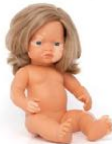
MUÑECA CON VITÍLIGO REF 1-31228