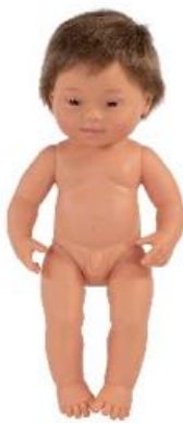
BABY SINDROME DE DOWN EUROPEO NIÑO REF 1-31068 AFRICANO NIÑO REF 1-31069