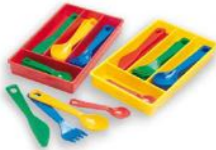
CUBERTERÍA DE JUGUETE PARA 4 REF 231-14230

Este colorido juego de té incluye cuatro sets completos con platos, tazas, platillos, cuchillos, cucharas y tenedores, todo hecho de plástico resistente. Perfecto para fomentar el juego imaginativo, desarrolla habilidades sociales y motricidad fina. Además, los cubiertos están coordinados por colores, lo que ayuda a los niños a reconocer y combinar colores. Edad recomendada: a partir de 3 años.