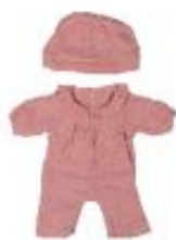
PIJAMA ROSA CON GORRO REF 1-31584