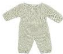
PIJAMA DE PUNTO VERDE REF 1-31602