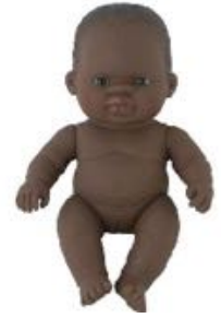
AFRICANA REF 1-31144