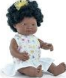
MUÑECA AFRICANA CON ROPA REF 1-33207