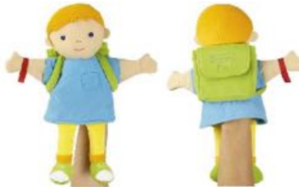
MARIONETA TOM REF 77-352497

Fabricado en poliéster y terciopelo de algodón, lavable a máquina a 30 °C. Dejar secar lentamente a temperatura ambiente. Altura: 32 cm.