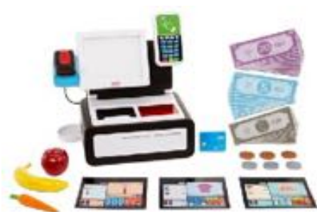
MI PRIMERA CAJA REGISTRADORA REF 24-656163

Baúl de tela que, una vez abierto, recrea un mercado donde los más pequeños podrán reconocer y recrear distintas situaciones cotidianas, apoyados en las frutas y verduras de Miniland (de venta por separado). Su plegado permite almacenar otros elementos y transportarlo fácilmente, ayudando a que los niños aprendan a recoger y desarrollen su sentido de la responsabilidad. Muy fácil de lavar al estar confeccionado en tela sintética. Dimensiones: 30x41x32 cm. 70 cm de altura una vez desplegado. Recomendado de 3 a 9 años.