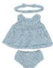
VESTIDO Y DIADEMA REF 1-31687