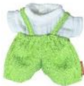
PETO Y CAMISETA CALOR REF 1-31573