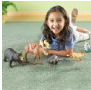
ANIMALES SELVA MAMAS Y BEBES JUMBO REF 137-0839

Estos animales de la selva están acompañados de sus bebés. Conoce cada una de estas especies, como son y como viven gracias a estas figuras. Incluye 6 figuras: Mamá elefante y su bebé; Mamá tigresa y su bebé; Mamá gorila y su bebé. Recomendado a partir de 2 años.