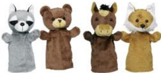
MARIONETAS ANIMALES REF 105-51803

Estructura de madera en forma de escenario con 5 decorados. Realizado en madera y con pinturas no tóxicas testadas. Medidas: 28x20x25 cm