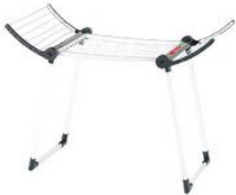
TENDEDERO REF 27-6735

Medidas: 17 x 29 x 15 cm. Edad recomendada: A partir de los 5 años.