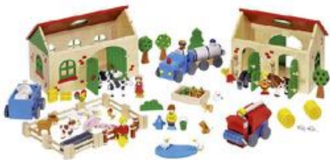
MI GRANJA REF 105-58598

Usa la grúa magnética para cargar contenedores en el tren. Luego presiona el botón en la locomotora para conducir alrededor de la pista ovalada y realizar entregas. A partir de 3 años.