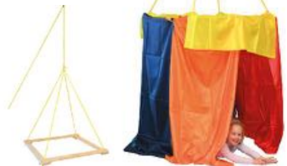
ESTRUCTURA PARA TIENDA REF 342-110354

Estructura de madera maciza. Con nuestros paneles de tela (342-110368) y unos clips universales (342-110351), los niños podrán construir una tienda de campaña de colores en un abrir y cerrar de ojos. Se puede fijar a cualquier altura para que incluso los más mayores puedan crear su propio reino con los largos paneles de tela. El set incluye 4 piezas de madera para la estructura y una cuerda de 5 metros. Se entrega desmontado. Dimensiones: 100 x 1000 x 1,5cm. Cuerda 5 m. Recomendado a partir de 3 años.