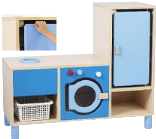
MUEBLE COMBINADO DE LAVANDERÍA CLOROFILE REF 77-372270

Un espacio completo para clasificar, lavar y organizar las prendas de ropa de los muñecos: 1 cesto de la ropa, 1 lavadora y 1 armario con 2 estantes con puertas que disponen de un sistema para no pillarse los dedos. El mueble combinado de lavandería se puede conectar con el Mueble combinado de cocina Clorofile y el Mueble combinado de baño Clorofile (tornillería incluida). Pies de plástico para facilitar la limpieza. Melaminado en color abedul de 18 mm de grosor. L/a/A: 100 x 39 x 86 cm; Alt. tablero de juego: 49 cm