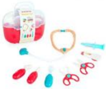
SET MÉDICO DE JUGUETE REF 1-97012

Set médico de juguete que permite a los niños jugar a ser profesionales de la salud, desarrollando habilidades cognitivas y emocionales. Incluye 8 utensilios esenciales y un maletín para guardarlos. Recomendado a partir de 3 años.