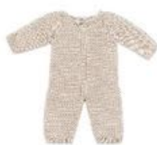
PIJAMA DE PUNTO LINO REF 1-31605