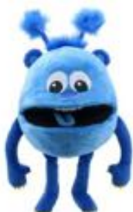
BABY MONSTER AZUL REF 311-PC004401

Marioneta adecuada para niños a partir de 18 meses.