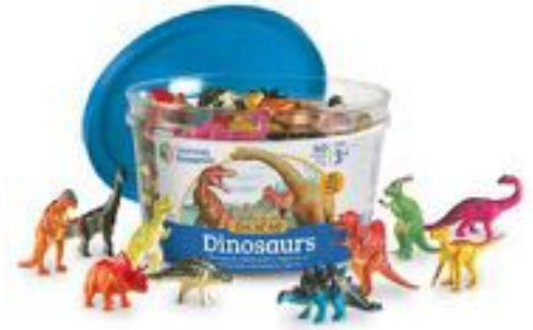
DINOSAURIOS REF 137-0811

Este set incluye 60 peces de 12 especies. Viene presentado en cubo con asa. Para niños de 3 a 7 años.