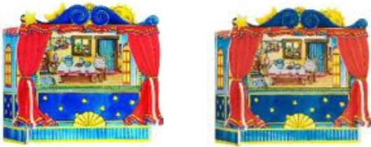
TEATRO PARA MARIONETAS DE DEDOS REF 105-51786

Estructura de madera en forma de escenario con 5 decorados. Realizado en madera y con pinturas no tóxicas testadas. Medidas: 28x20x25 cm