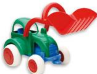
TRACTOR DIGGER REF 180-21215

Camión volquete con la cubeta abatible. Fabricado en plástico de alta calidad no tóxico y libre de ftalatos. Medida: 28 cm. A partir de 1 año.