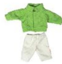
CHAQUETA Y PANTALÓN ENTRETIEMPO REF 1-31581