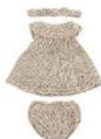
VESTIDO Y DIADEMA REF 1-31653