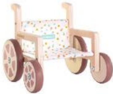
SILLA DE RUEDAS REF 1-31183

Silla pequeña de paseo plegable en forma de tijera con estampado vichy. Tiene una estructura metalizada muy resistente que puede plegarse completamente. El muñeco que puede ir en la sillita puede medir entre 30 y 42 cm. La tela del cochecito se retira fácilmente para poder lavar a máquina. Medidas: Altura 27cm, Ancho 53cm. Recomendado a partir de 2 años.