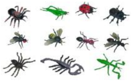
INSECTOS 12 FIGURAS REF 1-27480