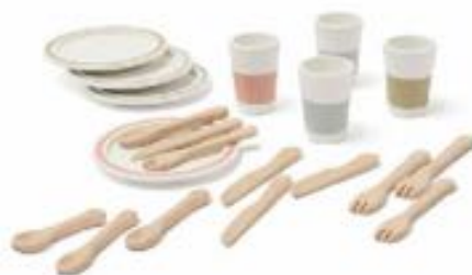
CONJUNTO DE VAJILLA REF 318-1000565