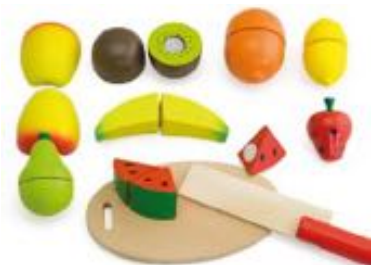
FRUTAS PARA CORTAR REF 60-16290A

Contiene 10 piezas entre ellas: frutas, hortalizas, pan, huevos, una tabla de madera y un cuchillo de madera carente de filo. Recomendado a partir de 18 meses.