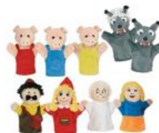
MARIONETAS CLÁSICAS: CAPERUCITA ROJA + LOS TRES CERDITOS REF 13-65001

Conjunto compuesto de 8 títeres de mano + CD audio (sin imágenes) con la grabación de sonido completa (música y voz) para la representación teatral del guión de 2 cuentos + libro de diálogos (libreto) con los 2 cuentos. Incluye guía pedagógica. El CD audio: contiene música y voz de los personajes de cada cuento, interpretado por actores profesionales en diferentes idiomas. Permite al profesor representar los cuentos sin necesidad de relatarlos. También incluye en una pista aparte, la música de los cuentos por separado.