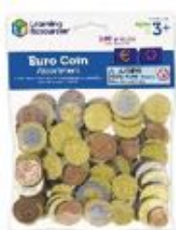
SET MONEDAS EUROS REF 137-LSP0026-EUR

Este moderno puesto de venta de madera lacada y natural tiene aún más que ofrecer a parte del amplio mostrador de venta: muchos estantes, un mostrador lateral adicional, 3 cajones, una puerta corredera y un reloj de madera ajustable para mostrar el "horario de apertura". Dimensiones: 87 x 78 x 112 cm. Altura de trabajo 56 cm. Recomendado a partir de 3 años.