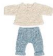
JERSEY Y PANTALÓN REF 1-31686