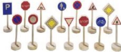
PACK DE SEÑALES DE TRÁFICO REF 105-WM397

Juego de Parking de madera con cuatro niveles de aparcamiento e incluye todos los detalles necesarios. Incluye un pequeño helicóptero de madera, 2 pequeños coches, rampas para bajar los coches de niveles y que se deslicen a través de ellos. Dimensiones: 48x30x 38 cm.