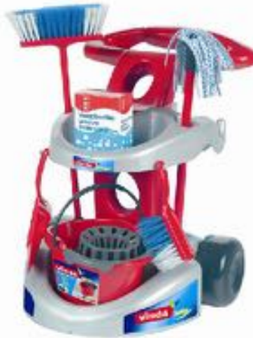
CARRITO DE LIMPIEZA REF 27-6721

Teclas blanditas y sonido de ring. Dimensiones: 18x19x8 cm.