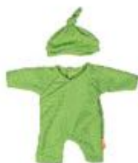
PIJAMA VERDE CON GORRO REF 1-31577

Conjunto de ropa para muñecos de hasta 32 cm, diseñado para fomentar el juego simbólico y el cuidado. Los conjuntos incluyen pijamas, vestidos, conjuntos de verano e invierno, todos hechos con materiales reciclados y con un estilo artesanal. Perfectos para desarrollar la imaginación de los peques mientras recrean momentos de cuidado y diversión. Recomendado a partir de 9 meses.