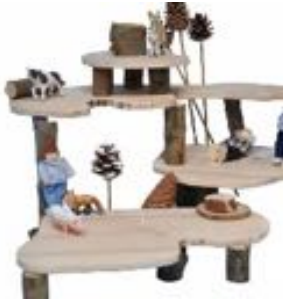
PLATAFORMA ABIERTA REF 328-5046

El accesorio imprescindible para tus maravillosos minimundos. Con este pack de 4 plataformas en diferentes tamaños de madera podrás crear estupendos escenarios. Recomendado a partir de 3 años.