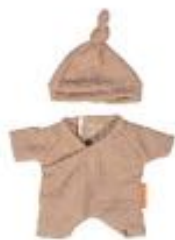
PIJAMA MARRÓN CON GORRO REF 1-31571

Conjunto de ropa para muñecos de hasta 21 cm, diseñado para fomentar el juego simbólico y el cuidado. Cada conjunto incluye piezas cómodas y atractivas, desde pijamas y vestidos hasta conjuntos de verano e invierno, todos fabricados con materiales reciclados y con un toque artesanal. Perfecto para desarrollar la imaginación y creatividad de los peques mientras cuidan a sus muñecos. Recomendado a partir de 9 meses.