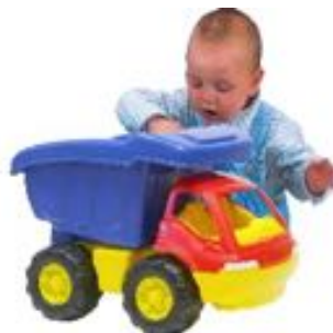
SUPER VOLQUETE REF 1-45150

BIO camión volquete, fabricado con 90% de biobase, 100% reciclable y 100% sostenible. Medidas: 29.5 x 15 x 17 cm. Edad recomendada: a partir de 2 años.