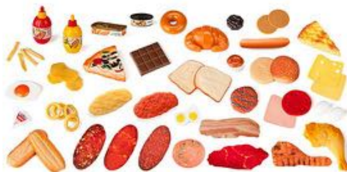
COMIDA RÁPIDA - PACK 52 PIEZAS REF 1-30815

Lote de 48 piezas de verduras de tamaño pequeño. Incluye: 6 tomates, 6 cebollas, 6 pimientos rojos, 6 pimientos verdes, 6 puerros, 6 patatas, 6 zanahorias y 6 calabacines. A partir de 3 años.