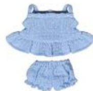
VESTIDO CALOR REF 1-31574