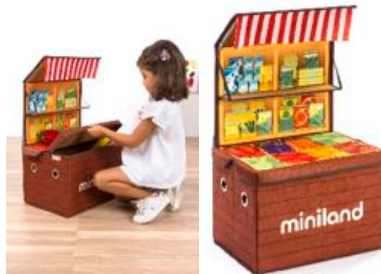
MARKET BOX REF 1-97099

Caja de madera vacía. Ideal para equipar el puesto de mercado. Tamaño del artículo: 14x10x7,3 cm. Recomendado a partir de 3 años.