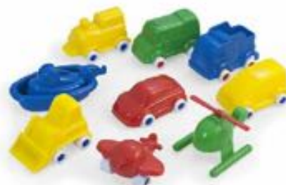
MINIMOBIL 9 CM 9 UDS REF 1-27470

Fabricados en materiales eco-friendly que reducen el impacto medio ambiental. De diseño robusto y duradero, con ruedas muy seguras no extraíbles y ejes de alta resistencia. Contenido: 1 volquete, 1 grúa, 1 formula, 1 coche y 1 furgoneta. Medida: 12 cm. Recomendado de 18 meses a 5 años.