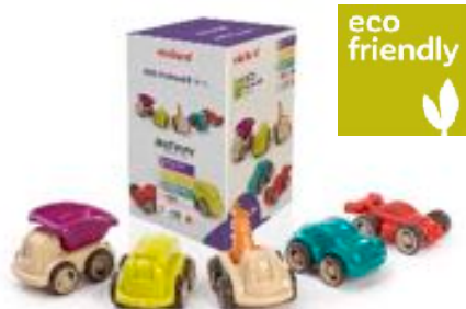
ECO MINIMOBIL 12 CM 5 PCS REF 1-32254

8 coches de 4 colores. Madera teñida. Tamaño: 7x3,5x3 cm. Ruedas no son desmontables.