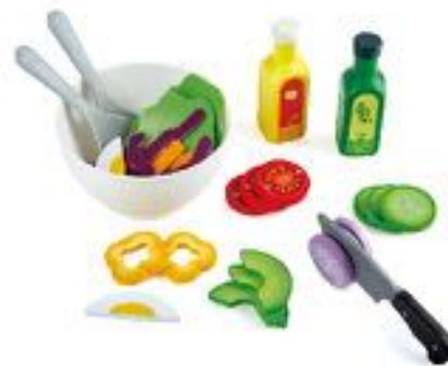
JUEGO DE ENSALADA REF 92-E3174

Set de cocina de Juguete formado por un Wok, verduras y elementos para preparar un rico salteado. Ideal para que los niños se familiaricen con la comida sana y saludable. Incluye: Wok (17 cm), pinzas, espátula, verdura variada (brócoli, pimiento, guisantes...), recipiente para llevar y una galleta de la suerte. Edad recomendada: de 18 meses a 5 años.