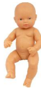
EUROPEA REF 1-31032