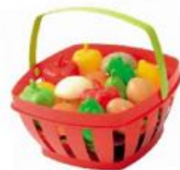
CESTA FRUTAS Y VERDURAS REF 134-966

Variado surtido de hortalizas. Se adjunta guía didáctica con propuesta de actividades.