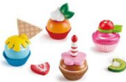
CUPCAKES REF 92-3157

Incluye una pieza de pan tostado, una barra de pan, un cruasán, una galleta con chispas de chocolate, una galleta de soda, una galleta con mermelada, una galleta de mantequilla con forma de corazón y un pastel en capas. Elaborado en fieltro y textil.