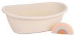
BAÑERA Y ESPONJAS REF 1-31100

Bañera de bebé fabricada con bioplástico procedente de la caña de azúcar, para bañar a los muñecos y muñecas Miniland dolls de hasta 40cm. Incorpora una esponjita con forma de arcoíris para completar el baño. Ancho de la bañera 42cm. Recomendado a partir de 3 años.