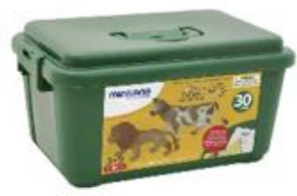
ANIMALES DE GRANJA Y SELVA 30 FIGURAS REF 1-25140