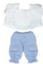
BLUSA Y PANTALÓN CALOR REF 1-31586