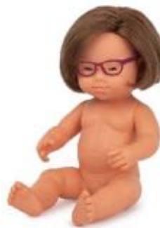
MUÑECA BEBÉ CAUCÁSICA CON GAFAS SIN ROPA REF 1-31110