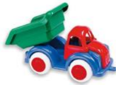
CAMIÓN VOLQUETE TIPPER REF 180-21210

Camión de bomberos con escalera. Fabricado en plástico de alta calidad no tóxico y libre de ftalatos. Medida: 28 cm. A partir de 1 año.