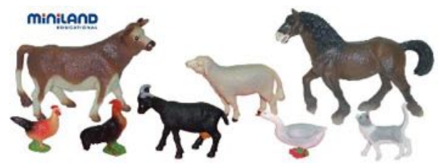
ANIMALES GRANJA 11 FIGURAS REF 1-27420