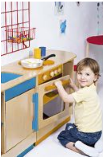
MULTICOCINA ROJA REF 77-371217

Un juguete clásico pero en su versión más moderna y especial para espacios reducidos. Compacta pero sin perder un solo detalle cuenta con horno, lavavajillas, ollas y sartenes. Dos juegos de platos y cubiertos además de otros accesorios. Medidas: 88.5 cm de alto. 47 cm de largo.