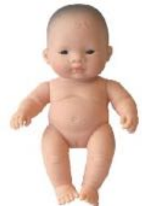
ASIÁTICA REF 1-31146