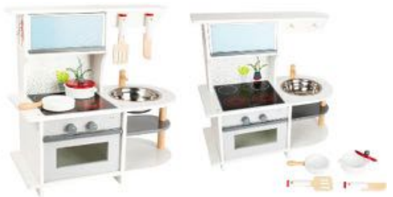
COCINA ENCANTO REF 175-11159

Un espacio de cocina compacto y funcional: 2 placas de cocción, 1 horno, 1 fregadero, 1 nevera y 1 lavadora. Medidas L/a/An/Al: 100 x 35 x 76 cm. Altura del plano de juego: 59 cm.