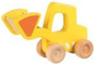
PALA CARGADORA REF 105-55896

Garaje grande de madera contrachapada con barniz natural para jugar en grupo. Las 6 rampas que unen los 3 niveles facilitan la circulación. Tamaño: 51 x 41 x 32 cm. Se entrega desmontado (con instrucciones claras de montaje) y no incluye coches ni accesorios. Dimensiones: 51x41x32 cm