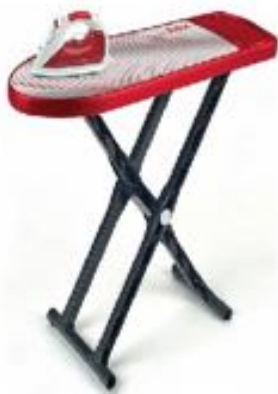
SET DE PLANCHADO BOSCH REF 27-6302

Set de planchado Bosch con tabla de planchar y plancha. Se puede regular la altura de 47 a 52 cm. La plancha cuenta con función de pulverización de agua.