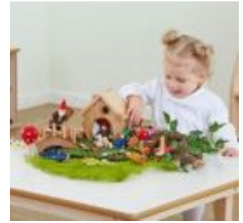
CABAÑA DE MADERA REF 234-EY10469

Una atractiva y bella cabaña de un mundo pequeño donde habitan elfos y hadas. Incorpora esta mini cabaña al juego imaginativo y prepara el escenario para una aventura. Accesorios y muñecos no incluidos. Medidas: 17x15x10 cm. Recomendado a partir de 3 años.