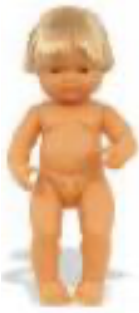
EUROPEO REF 1-31051