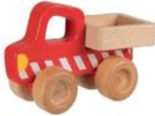
CAMIÓN VOLQUETE REF 105-55883

Hormigonera de juguete fabricada en madera maciza y con neumáticos de goma. Tamaño: 17x10x12 cm. Recomendado partir de 2 años.