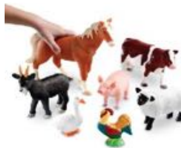
ANIMALES DE LA GRANJA JUMBO REF 137-0694

Un set de 60 figuras animales salvajes de juguete. Viene presentado en cubo con asa. De 3 a 7 años.