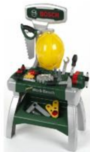
BANCO DE TRABAJO BOSCH REF 27-8612

Incluye múltiples accesorios: martillo, casco, sierra, lima... Fácil montaje. Dimensiones montado: 49x71 cm de altura