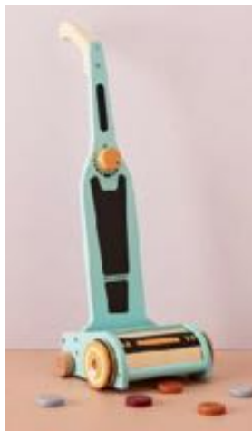
ASPIRADORA REF 318-1000641

Plegable y con pestillo de seguridad para un soporte estable. Dimensiones: 49x34x63 cm. Recomendado a partir de 3 años.