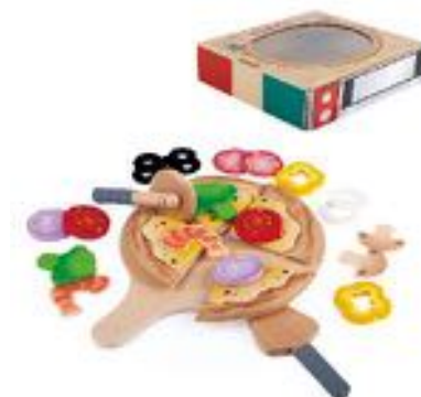
JUEGO DE PIZZA REF 92-E3173

Set de desayuno de juguete con una cesta para almacenarlos. Incluye: cesta de la compra, vaso de zumo, tazón de cereales, vaso de yogurt y 12 piezas de comida como plátanos, fresas, melón, tortitas, tostadas... La cesta de la compra mide 18 cm de largo y 11 cm de alto. Recomendado de 18 meses a 5 años.