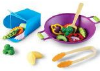
SET PARA PREPARAR UN SALTEADO REF 137-LER9264

Set de juguete para crear una refrescante ensalada de fruta fresca. Set de 18 piezas que incluye: media sandía que sirve como recipiente (20 cm.) y fruta variada como fresas, kiwi, naranja, piña... y cuchara para servir y 2 bols para comer la ensalada. Recomendado a partir de 18 meses.