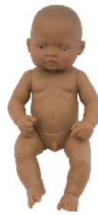
LATINO AMERICANO REF 1-31037