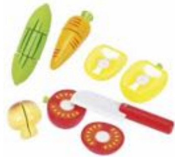
VERDURA CON VELCRO REF 105-51598

Conjunto de 5 verduras de madera. 2 mitades unidas por un sistema de velcro muy resistente. Corta con el cuchillo y la fruta estará partida por la mitad. El niño adquirirá la destreza necesaria para utilizar el cuchillo. Edad Recomendada: A partir de 3 años.