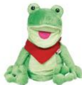
MARIONETA RANITA REF 105-51785

Con el Guante Cuentacuentos crearás momentos inolvidables. Podrás crear una historia diferente cada día gracias a los personajes de la granja y las diferentes actividades estimulantes: el patito tiene sonido, la ratita y la vaca son sonajeros y el dedo meñique posee efecto crujido.