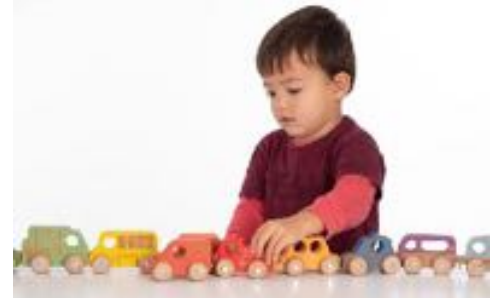
SET DE VEHICULOS DE MADERA EN COLOR REF 232-73508

Este set incluye 15 piezas con señales de tráfico. Tamaño de 10 cm. Fabricado de madera. A partir de 3 años.