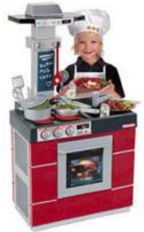
COCINA COMPACTA MIELE REF 27-9044

Divertida cocina con horno y fregadero. Su diseño permite que dos niños puedan disfrutar simultáneamente. Incluye accesorios para hacer el juego más entretenido y alegre. Dimensiones: 74 x 40 x 114 cm.