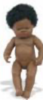
AFRICANA REF 1-31054