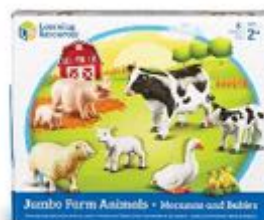
MAMÁS Y BEBÉS DE LA GRANJA JUMBO REF 137-0835

Conjunto de 8 animales de la granja de gran tamaño. Fabricados en plástico de gran calidad. Medidas de la vaca: 19x11,5 cm