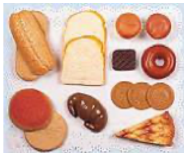
SURTIDO REPOSTERÍA 15 PIEZAS REF 1-30583