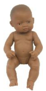
LATINO AMERICANA REF 1-31038