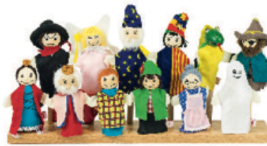
MARIONETAS DE DEDOS 12 UDS REF 105-SO401

Set de títeres de sombras que incluye los personajes más importantes para que los niños y no tan niños puedan representar los cuentos tradicionales y ampliando así su expresión verbal y habilidades de la narración. Incluye también los miembros de la familia para fomentar la creatividad o representar las historias familiares. Contenido: 28 figuras de entre 8 y 15 cms, 16 adhesivos retirables, 10 tiras transparentes y 10 palillos, 4 perinolas de madera de colores. Recomendado a partir de 3 años.