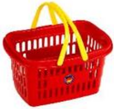
CESTA DE LA COMPRA REF 27-9692

Fabricada en plástico duradero con asas de borde redondeado para un agarre seguro, es ideal para guardar productos de juguete o transportar objetos. Dimensiones: 26,5 cm x 17,5 cm x 14 cm. Edad recomendada: a partir de 3 años.