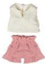
CAMISETA Y PANTALÓN CALOR REF 1-31585