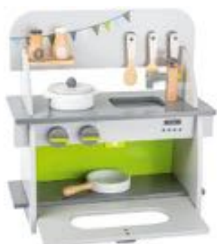
COCINA COMPACTA REF 175-11158

Preciosa nevera y congelador de madera, el juguete ideal para hacer ricas comilonas con la familia y muñecos. Medida: 30 x 30 x 73cm.