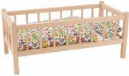
CAMA PARA MUÑECAS REF 105-RA107

Fabricada en madera de haya, diseñada para que las muñecas descansen cómodamente. Medidas: 60 x 29 x 25 cm. (No incluye ropa de cama). Edad recomendada: a partir de 3 años.