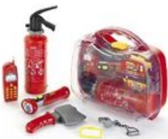
MALETÍN BOMBERO REF 27-8984

Incluye múltiples accesorios: martillo, casco, sierra, lima... Fácil montaje. Dimensiones montado: 49x71 cm de altura