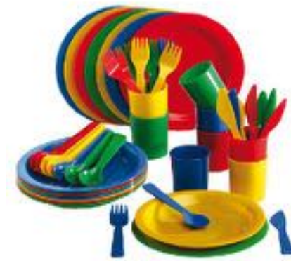
GRAN VAJILLA REF 77-333150

48 piezas de plástico. 6 elementos diferentes en 4 colores. Cada color se duplica. En plástico muy resistente. Ø plato llano: 19 cm; Ø plato hondo: 18 cm; altura vaso: 8 cm; longitud cubiertos: 13,5 cm.