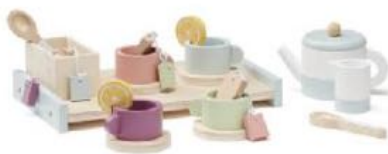
CONJUNTO DE TÈ REF 318-1000455