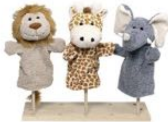
MARIONETAS ANIMALES SALVAJES REF 105-15354

Set de 6 marionetas de animales salvajes distintos. Con cuerpo de felpa. Medida de los títeres: 7.5 cm. aproximadamente. Edad Recomendada: A partir de 3 años.