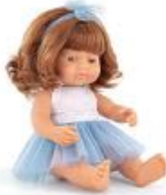
MUÑECA EUROPEA PELIRROJA CON ROPA REF 1-33203