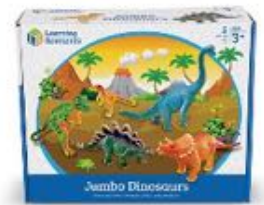
DINOSAURIOS 1 JUMBO REF 137-0786

Conjunto de 5 dinosaurios de gran tamaño. Fabricados en plástico de gran calidad. Dimensiones del dinosaurio de mayor tamaño: 25x24 cm.