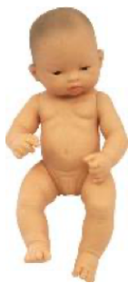
ASIATICA REF 1-31036