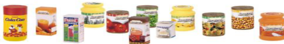
SURTIDO DE ALIMENTOS ENVASADOS 12 PIEZAS REF 1-30596

Set de 52 alimentos de comida rápida para jugar y aprender sobre nutrición y hábitos saludables. Fabricados con materiales de alta calidad y a escala real. Recomendado a partir de 3 años.