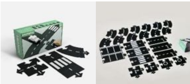
CARRETERA WAYTOPLAY HIGHWAY REF 329-24HI

Coloridos vehículos de madera maciza de haya, cada uno con cuatro ruedas giratorias, ejes metálicos y marcas grabadas con láser. El láser crea una ligera hendidura en la madera, lo que hace que las piezas sean táctiles para proporcionar un aspecto de descubrimiento sensorial. Incluye 12 unidades. Recomendado a partir de 12 meses.