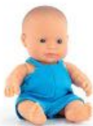
BABY EUROPEO NIÑO CON ROPA REF 1-33000

Muñecos bebé de 21 cm diseñados para enseñar a los más pequeños valores fundamentales como la amistad, la diversidad y el compartir desde temprana edad. Cada muñeco, articulado y anatómicamente correcto, viene con su propia ropita especial y una bolsita kraft de regalo. Fabricados en vinilo suave de alta calidad, con un delicado aroma a vainilla, son perfectos para fomentar el juego simbólico y la empatía. Recomendados a partir de 10 meses, estos muñecos ayudarán a desarrollar la imaginación y las habilidades sociales mientras los niños disfrutan de un juego lleno de cariño y diversión.