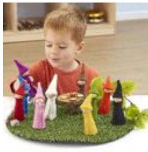
ELFOS ARCO IRIS - 10UD REF 234-EY06958

Utilícelos para crear minimundos, así como en actividades de enhebrado y encaje. Puedes utilizarlos con cintas, cordones y materiales naturales. Unidades en el kit: 3 árboles y 6 cordones. Recomendado a partir de 3 años.