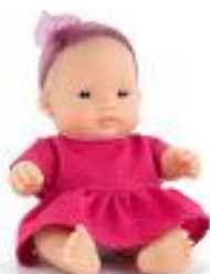
BABY ASIÁTICA NIÑA CON ROPA REF 1-33004