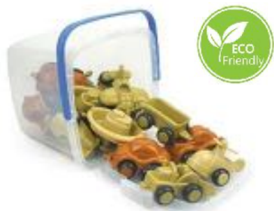
BOTE CHUBBIES BIO REF 180-20-41140SP

Incluye 30 vehículos con formas distintas. Fabricados en plástico flexible de alta calidad no tóxico y libre de ftalatos. Medida aproximada: 7 cm. Edad recomendada: a partir de 1 año.