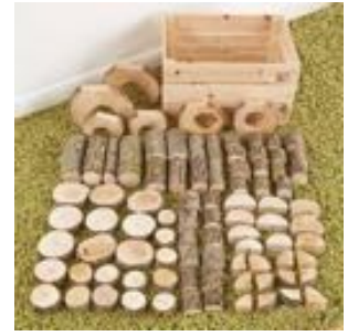
CAJA DE CONSTRUCCION 90 PIEZAS REF 328-36958

Las torres Trog son un conjunto natural de casas para complementar tus minimundos. Incluye 6 torres, 3 de ellas con techo plano para que puedan apilarse y crear torres de dos plantas. Añade hadas o duendes y deja volar la imaginación de los más pequeños. Medidas aproximadas: 14 cm altura, 7 cm diámetro. Recomendado a partir de 3 años.