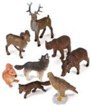
ANIMALES DEL BOSQUE 8 FIGURAS REF 1-25126