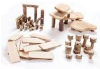
SET DE CONSTRUCCION RUSTICO REF 328-48673

Una atractiva y bella cabaña de un mundo pequeño donde habitan elfos y hadas. Incorpora esta mini cabaña al juego imaginativo y prepara el escenario para una aventura. Accesorios y muñecos no incluidos. Medidas: 17x15x10 cm. Recomendado a partir de 3 años.