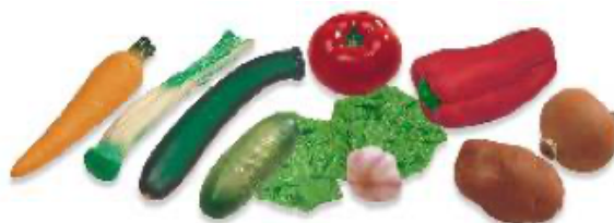
HORTALIZAS 11 PIEZAS REF 1-30582

Variado surtido de hortalizas. Se adjunta guía didáctica con propuesta de actividades.