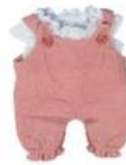
PETO Y BLUSA CALOR REF 1-31580