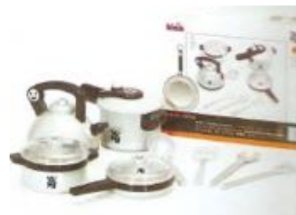
SET DE CACEROLAS REF 27-9430

Amplio equipamiento con cocina, fregadero y horno. Mandos con sonidos de "clic" para un juego realista. Incluye sartén, tres utensilios de cocina, especieros, sartén y olla con tapa de madera a juego. Medidas: 36x17x37 cm. Altura de trabajo 20 cm. Recomendado a partir de 3 años.