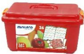
SURTIDO DE FRUTAS, HORTALIZAS Y FRUTOS SECOS 36 PIEZAS REF 1-30811