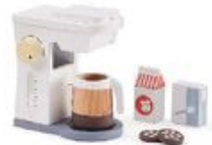
CAFETERA REF 318-1000262

Set para 4 niños. Fabricada en plástico de alta calidad. Formada por 17 piezas: Tenedores, cucharas (2 tamaños diferentes) y cuchillos. A partir de 2 años.