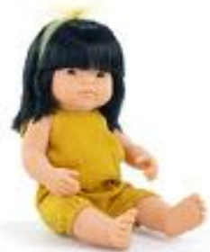
MUÑECA ASIÁTICA CON ROPA REF 1-33204