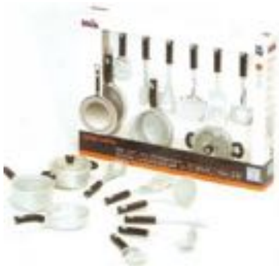
SET CACEROLAS Y UTENSILIOS REF 27-9428