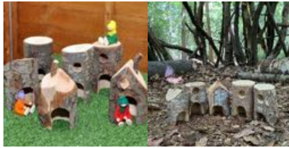
TORRES TROG REF 328-30799

El accesorio imprescindible para tus maravillosos minimundos. Con este pack de 4 plataformas en diferentes tamaños de madera podrás crear estupendos escenarios. Recomendado a partir de 3 años.