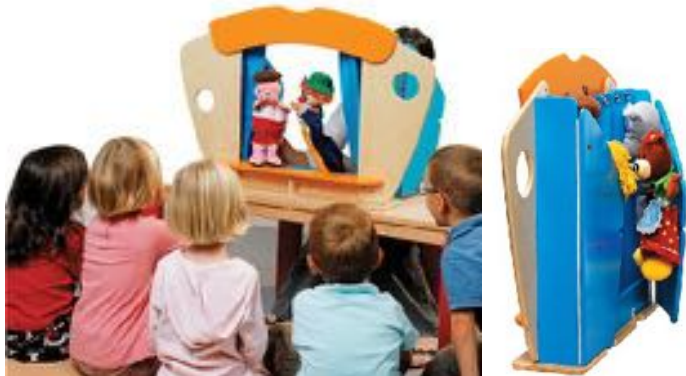
GUIÑOL REF 77-336194

Fabricado en poliéster y terciopelo de algodón, lavable a máquina a 30 °C. Dejar secar lentamente a temperatura ambiente. Altura: 32 cm.