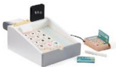
CAJA REGISTRADORA REF 318-1000259