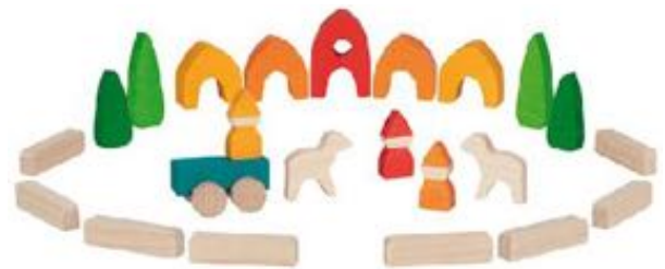
MI PEQUEÑO PUEBLO REF 105-58365

Los enanitos, con este conjunto de piezas de madera, se sentirán como en casa gracias al precioso set de construcción de mi pequeño pueblo. Material: Madera. Tamaño Casita Roja: 3,3x1,5x4,5 cm. Número de piezas: 25. Recomendado a partir de 3 años.