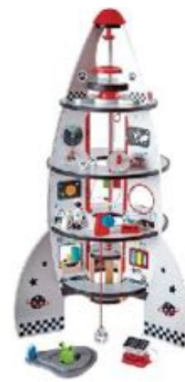
COHETE ESPACIAL 4 PISOS REF 92-3021

Cohete de 4 plantas con ascensor, la planta superior se convierte en un cohete pequeño de aterrizaje. Además, trae 1 astronauta, 1 alien, 1 robot, 1 vehículo-cámara con vagoneta imantada y muchas herramientas de investigación, así hasta un total de 20 elementos distintos. Fabricado en madera. A partir de 3 años.