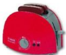
TOSTADORA REF 27-9578 PVP: 15,98 €

Tostadora de madera. Tamaño: 26 x 20 x 10 cm. Incluye accesorios. Recomendado a partir de 2 años.