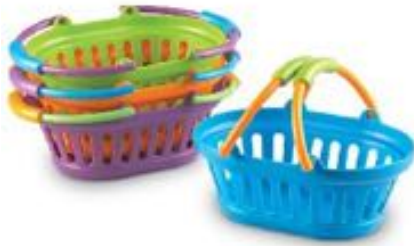
SET 4 CESTAS DE LA COMPRA REF 137-LER9724-4

Fabricada en plástico duradero con asas de borde redondeado para un agarre seguro, es ideal para guardar productos de juguete o transportar objetos. Dimensiones: 26,5 cm x 17,5 cm x 14 cm. Edad recomendada: a partir de 3 años.