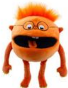
BABY MONSTER NARANJA REF 311-PC004404

Marioneta de punto con forma de calcetín y chirriador en la lengua, ideal para estimular la imaginación de los niños. Dimensiones: 38 cm de altura, 14 cm de anchura, 13 cm de longitud. Apta para niños a partir de 18 meses.