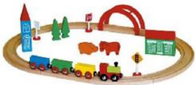
CIRCUITO DE TREN DE MADERA REF 77-345457

Un circuito completo de madera compuesto por: 10 vías con 1 puente, 1 locomotora, 3 vagones, 3 señales, 2 edificios, 2 árboles y 2 animales. Tamaño de la pista: 60 x 44 cm. Juego de 25 piezas. Recomendado a partir de 3 años.