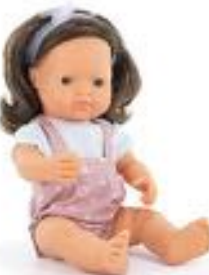
MUÑECA EUROPEA CASTAÑA CON ROPA REF 1-33211