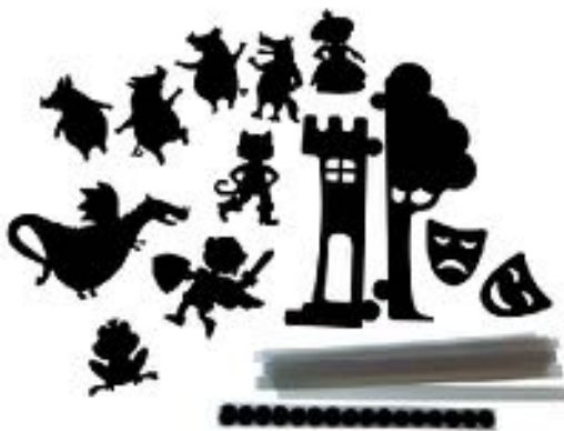
PERSONAJES DE CUENTOS DE SOMBRAS REF 12-1090

Set de 4 marionetas de peluche con forma de animales. Medida aproximada: 27.5 cm. Incluye zorro, caballo, mapache y oso. Edad Recomendada: A partir de 4 años.