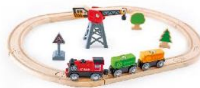
CIRCUITO DE ENTREGA DE CARGA REF 92-E3731

Usa la grúa magnética para cargar contenedores en el tren. Luego presiona el botón en la locomotora para conducir alrededor de la pista ovalada y realizar entregas. A partir de 3 años.