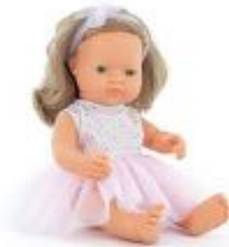
MUÑECA EUROPEA RUBIA CON ROPA REF 1-33208