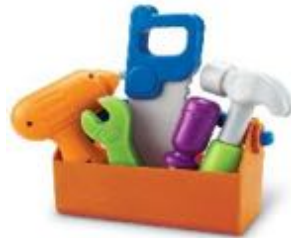
SET DE HERRAMIENTAS REF 137-LER9230

Set de herramientas de juguete hechas de plástico suave y duradero. Incluye: martillo, destornillador, llave inglesa, taladro (con efectos de sonido) y caja de herramientas. Recomendado de 2 a 4 años.