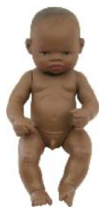
AFRICANO REF 1-31033