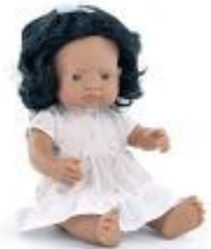
MUÑECA LATINOAMERICANA CON ROPA REF 1-33210