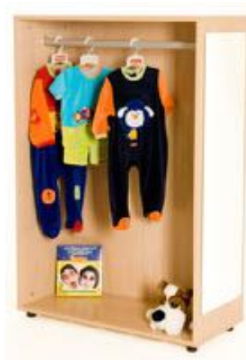
MUEBLE DE DISFRACES PARA PARED CERRADO REF 40-602003

Mueble compacto para disfrazarse y maquillarse, fijo o móvil gracias a sus ruedecitas. Equipado con un espejo de pie de plexiglás irrompible, una barra para colgar la ropa y 4 cajones de plástico transparente. De madera melaminada color haya. Dimensiones: 70x55x124 cm.