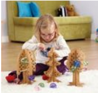
ARBOLES PARA HILAR 3 PIEZAS REF 234-EY05292

El complemento perfecto para la construcción y creación de minimundos. Esta caja de construcción de minimundos está formada por 90 piezas de madera natural de diferentes formas y tamaños. Troncos largos y cortos, medios y cuartos troncos, rodajas de madera, puertas, ventanas... y todo incluido dentro de una caja de madera donde poder almacenarlas. Recomendado a partir de 3 años.