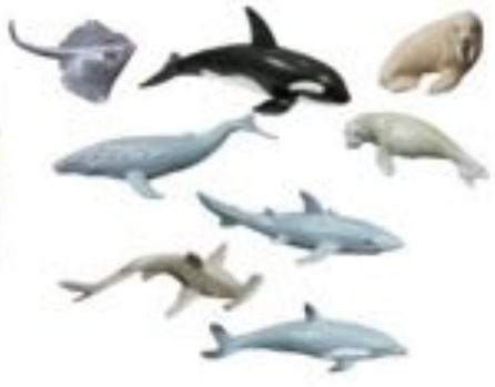
ANIMALES MARINOS 8 FIGURAS REF 1-27460