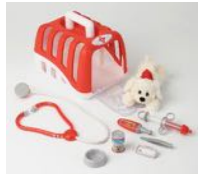
MALETÍN VETERINARIO REF 27-4831

Completo maletín que incluye: linterna, extintor, hacha, silbato y una radio para comunicarse con el resto del equipo. Edad recomendada: A partir de los 3 años.