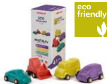
ECO MINIMOBIL 9 CM 4 PCS REF 1-32253

Incluye 15 vehículos de 5 profesiones distintas. Plástico flexible de alta calidad no tóxico y libre de ftalatos. Medida aproximada: 10 cm. A partir de 1 año.