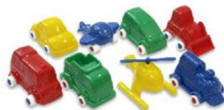
MINIMOBIL CONTENEDOR 36 UDS REF 1-27471

Cubo de ECO-Vehículos, aviones y barcos Chubbies. 10 modelos. En total 15 piezas de vehículos. Recomendado a partir de 1 año.