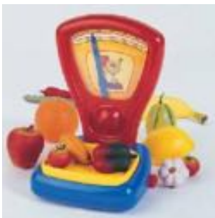
BALANZA REF 27-9322

Báscula de plato de madera maciza: práctica, exacta, robusta. Tamaño: 12x16x17 cm. Recomendado a partir de 3 años.