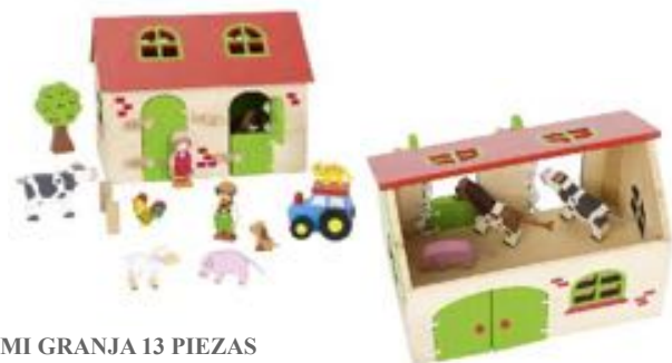
MI GRANJA 13 PIEZAS REF 105-58497

Cohete de 4 plantas con ascensor, la planta superior se convierte en un cohete pequeño de aterrizaje. Además, trae 1 astronauta, 1 alien, 1 robot, 1 vehículo-cámara con vagoneta imantada y muchas herramientas de investigación, así hasta un total de 20 elementos distintos. Fabricado en madera. A partir de 3 años.