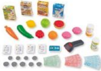
SUPER MARKET REF 134-350239

Supermercado con varios espacios de juego: caja, zona de frutas y verduras, pequeñas secciones, pesaje (nueva balanza mecánica: el peso mostrado se ajusta en función de los alimentos pesados). Incluye 42 accesorios. Dimensiones del producto montado 60x60x89 cm. Carrito: altura 44 cm. Recomendado a partir de 3 años.