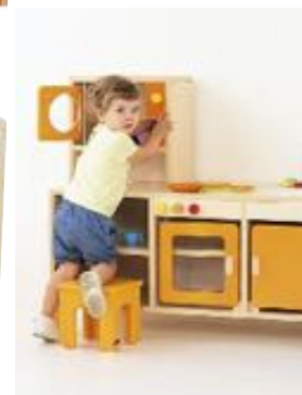
MUEBLE COMBINADO DE COCINA CLOROFILE REF 77-372272

Un espacio de cocina completo y funcional: 1 microondas, 1 horno con fogones, 1 fregadero y 1 armario con puerta que dispone de un sistema para no pillarse los dedos. El mueble combinado de cocina se puede conectar con el Mueble combinado de lavandería Clorofile y el Mueble combinado de baño Clorofile (tornillería incluida). Pies de plástico para facilitar la limpieza. Melaminado en color abedul de 18 mm de grosor. L/a/A: 100 x 39 x 86 cm; Alt. encimera: 49 cm.