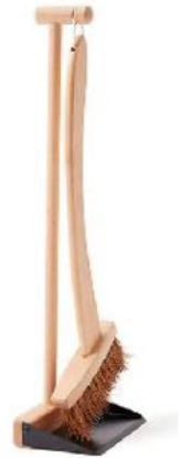
CONJUNTO DE ESCOBA Y RECOGEDOR REF 318-1000342

Altura 52,7cm. Recomendado a partir de 3 años.