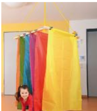
PANELES DE TELA PARA TIENDA - SET DE 6 REF 342-110368

Gran fuerza de sujeción. Gracias a su orificio, se pueden fijar a una tabla con clavos, por ejemplo. Plástico. Dimensiones: 7x2x3cm. A partir de 3 años.