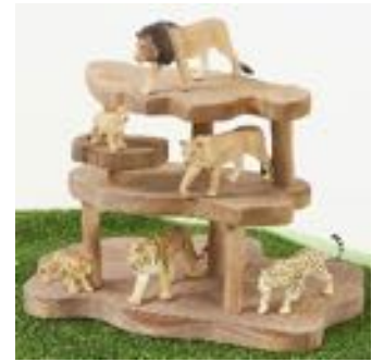
PLATAFORMA DE MADERA MINIMUNDOS REF 328-35146

Set de 50 bloques de construcción de madera natural con corteza, excelente para fomentar el pensamiento espacial y las habilidades motoras. Medidas discos: 4,5 cm diámetro, 15 cm largo. Medidas Palos: 6 cm diámetro, 18 cm largo. Recomendado a partir de 3 años.