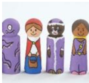
GENTE MADERA REF 234-EY05359

Un conjunto de figuras sencillas de madera. Añade a estas figuras fotografías de niños del colegio para que el juego de los niños resulte más familiar, o incluye fotos de profesionales para fomentar el conocimiento. También podrás utilizar pinturas para crear tus propios personajes para tu minimundo, o incluso utilizar abalorios como plumas o lentejuelas para llevar tus creaciones a un nivel superior. Incluye: 20 figuras de madera. Altura 9 cm. Recomendado a partir de 3 años.