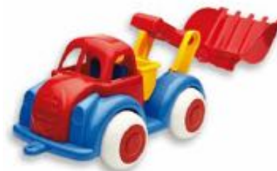
DIGGER TRUCK REF 180-21212

Tractor con pala movable. Fabricado con polipropileno flexible de alta calidad no tóxico y libre de ftalatos. Medida: 28 cm. A partir de 1 año.