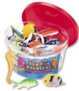
PECES DIVERTIDOS REF 137-0407

Este set incluye 60 peces de 12 especies. Viene presentado en cubo con asa. Para niños de 3 a 7 años.