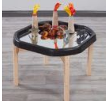
ESPEJO BANDEJA DE JUEGOS TUFF REF 234-FT2

Lámina reflectante con efecto espejo para colocar encima de la Bandeja TUFF para Actividades y Juegos. Fabricada en aluminio, por lo que no se rompe y es segura. Ideal para estudiar el reflejo, observar la simetría o como escenario de juego de minimundos. Medida: 86 cm diámetro. Recomendado a partir de 3 años.