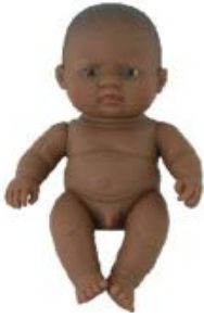
LATINO AMERICANO REF 1-31147