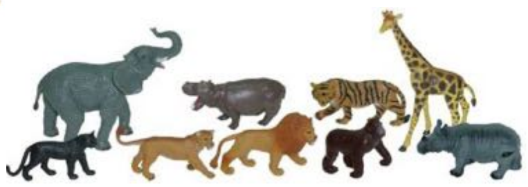
ANIMALES SALVAJES 9 FIGURAS REF 1-25119