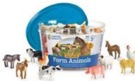
ANIMALES DE LA GRANJA REF 137-0810

Un set de 60 figuras de dinosaurios de 10 especies distintas. Viene presentado en cubo con asa. De 3 a 7 años.