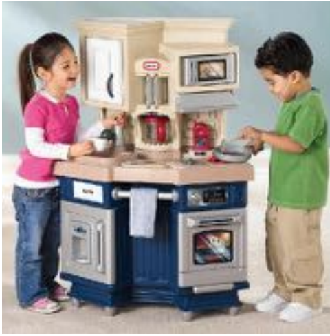
COCINA SUPERCHEF REF 24-614873

Conjunto de cocina compacto que incorpora horno, microondas, frigorífico, cocina, fregadero, armario... Además viene con 14 accesorios. Con sonidos que simulan el ruido al cocinar. Dimensiones: 112,5x60,5x62 cm.