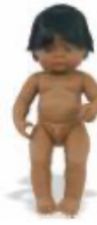
LATINO AMERICANO REF 1-31057