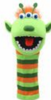
MARIONETA CALZETINES NARG REF 311-PC007035

Marioneta de punto con forma de calcetín y chirriador en la lengua, perfecta para estimular el juego y la imaginación. Dimensiones: 38 cm de altura, 14 cm de anchura, 13 cm de longitud. Apta para niños a partir de 18 meses.