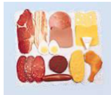
SURTIDO FIAMBRE 16 PIEZAS REF 1-30584

Las frutas más conocidas. Se adjunta guía didáctica con propuesta de actividades.