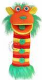
MARIONETA CALZETINES BOTONES REF 311-PC007031

Marioneta de punto con forma de calcetín y chirriador en la lengua, ideal para fomentar la imaginación y el juego. Dimensiones: 38 cm de altura, 14 cm de anchura, 13 cm de longitud. Apta para niños a partir de 18 meses.