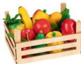
FRUTAS Y VERDURAS EN CAJA REF 105-51658

Cesta con frutas y verduras de madera. Incluye: 23 piezas. Ideal para equipar el puesto de mercado. A partir de 3 años.