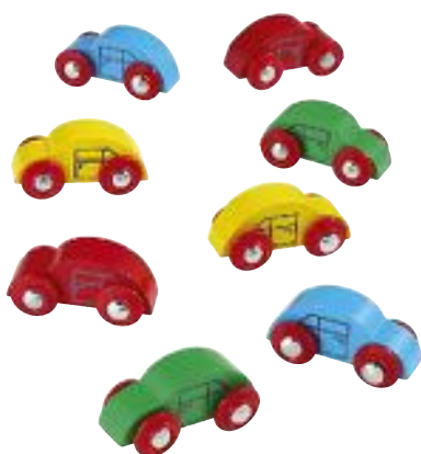
COCHES DE MADERA REF 77-333373

Fabricados en materiales eco-friendly que reducen el impacto medio ambiental. De diseño robusto y duradero, con ruedas muy seguras no extraíbles y ejes de alta resistencia. Contenido: 1 autobús, 1 excavadora, 1 monovolúmen y 1 coche. Medida: 9 cm. Recomendado de 18 meses a 5 años.