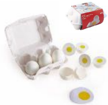
HUEVERA REF 92-3156

Conjunto de 6 frutas de madera. 2 mitades unidas por un sistema de velcro muy resistente. Corta con el cuchillo y la fruta estará partida por la mitad. El niño adquirirá la destreza necesaria para utilizar el cuchillo. Edad. A partir de 3 años.