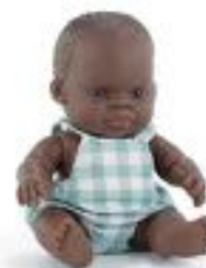
BABY AFRICANO NIÑO CON ROPA REF 1-33002