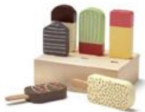
EXPOSITOR DE POLOS REF 318-1000340