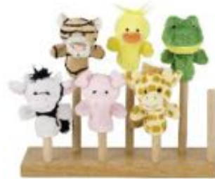
MARIONETAS DE DEDO ANIMALES SALVAJES REF 105-15418

Set de 8 marionetas de animales salvajes distintos. Con cuerpo de felpa. Medida de los títeres: 7.5 cm. aproximadamente. Edad Recomendada: A partir de 3 años.