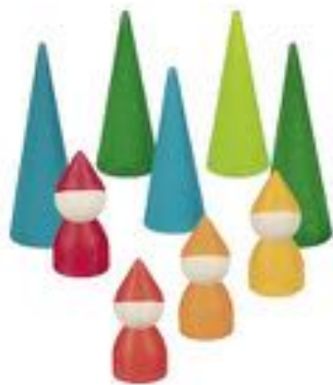
EL BOSQUE DE LOS GNOMOS REF 105-58468

Con este conjunto de bloques de madera podrás crear una magnífica y colorida casa de los Gnomos para construir tu minimundo y fomentar el juego imaginativo. Material: Madera. A partir de 3 años.