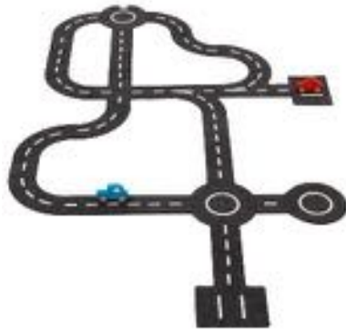
CIRCUITO CON DOS COCHES REF 105-53812

Tractor con pala cargadora fabricado en madera maciza. Tamaño: 18x6,5x12 cm. Recomendado a partir de 2 años.