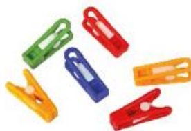
CLIPS UNIVERSAL 10 PCS REF 342-110351

Medidas: 90x40x132 cm. El mueble dispone de un espejo de seguridad en uno de sus laterales y barra central con sistema anticaída para colgar los disfraces. Dispone de ruedas para desplazarlo con facilidad.