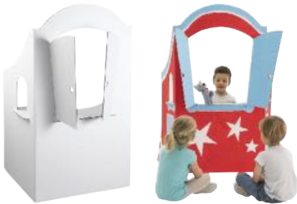
ESQUINA DE JUEGOS DE CARTÓN PARA DECORAR REF 77-336202

Un gran soporte de cartón precortado, para decorar y crear fácilmente un rincón de teatro o un puesto de la compra. Un mostrador y persianas permiten muchas interacciones entre los niños. En cartón blanco recto verso precortado. Tamaño: 87 x 31 x 133 cm (montado). Entregado plano. Recomendado a partir de 3 años.