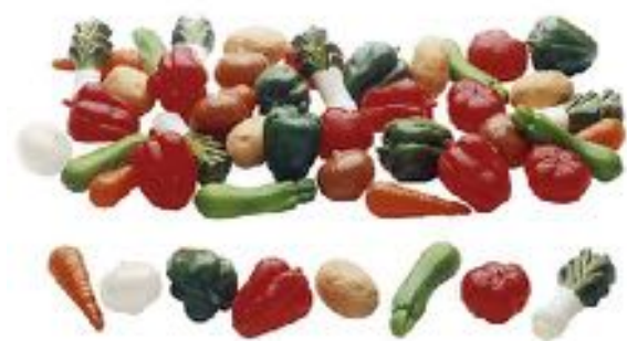
VERDURAS DEL MERCADO REF 77-387084

Lote de 48 piezas de verduras de tamaño pequeño. Incluye: 6 tomates, 6 cebollas, 6 pimientos rojos, 6 pimientos verdes, 6 puerros, 6 patatas, 6 zanahorias y 6 calabacines. A partir de 3 años.