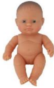
EUROPEA REF 1-31142