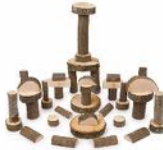
SET CONSTRUCCION NATURAL REF 328-7440

Set de construcción para la creación de minimundos con una combinación de 4 variedades de piezas fabricadas en madera natural. Incluye: Espirales y ventanas en formato torre, Columnas de madera para construcción, Tablones de madera, Plataformas abiertas de madera. Recomendado a partir de 3 años.