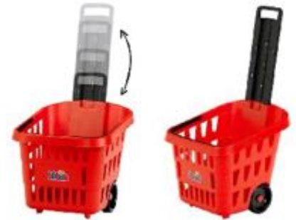
CARRITO DE LA COMPRA REF 27-7248

Carrito de la compra de plástico resistente con ruedas de giro libre y asa extraíble, ideal para juegos de rol. Perfecto para transportar alimentos de juguete, peluches o coches pequeños, fomentando la imaginación y habilidades sociales. Dimensiones: 30 cm x 28,6 cm x 53,2 cm. Edad recomendada: a partir de 3 años.