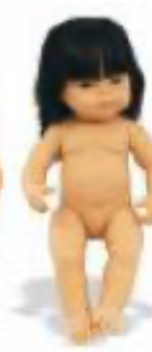
ASIÁTICA REF 1-31056