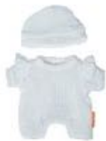
PIJAMA BLANCO CON GORRO REF 1-31572