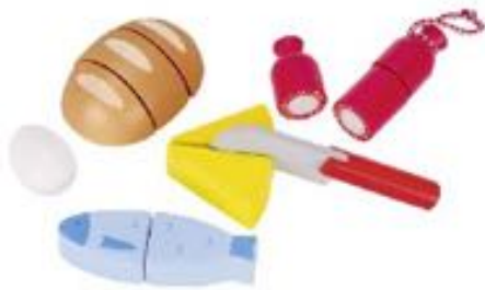
ALIMENTOS CON VELCRO REF 105-51563

Huevera con 6 huevos de juguete que se pueden abrir y que su interior permite juego muy realista.