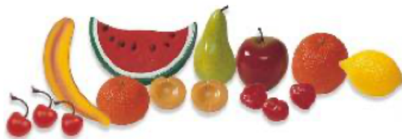
FRUTAS 15 PIEZAS REF 1-30581

Las frutas más conocidas. Se adjunta guía didáctica con propuesta de actividades.