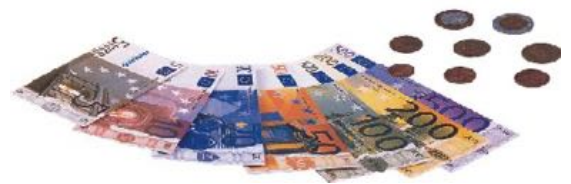
CARTERA DE EUROS REF 1-31908