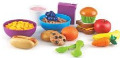
COMIDA DE NIÑOS PARA JUGAR REF 137-LER7711

Incluye una base de pizza que puede cortarse en porciones, un servidor de pizza, un cortador, gambas, verduras y otros ingredientes, incluso un horno que también sirve como caja de la pizza. A partir de 3 años.