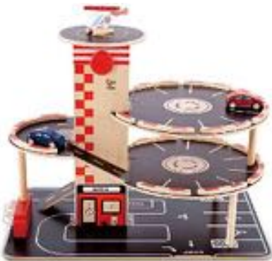
PARKING REF 92-3002

Juego de Parking de madera con cuatro niveles de aparcamiento e incluye todos los detalles necesarios. Incluye un pequeño helicóptero de madera, 2 pequeños coches, rampas para bajar los coches de niveles y que se deslicen a través de ellos. Dimensiones: 48x30x 38 cm.