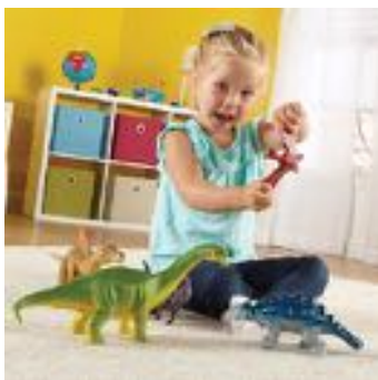
DINOSAURIOS 2 JUMBO REF 137-0837

Conjunto de 5 animales de la selva de gran tamaño. Fabricados en plástico de gran calidad. Medidas de la jirafa: 20x38 cm