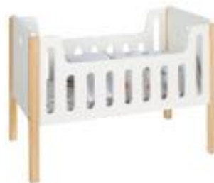
CUNA PARA MUÑECAS REF 175-12495

De abedul natural, incl. juego de cama. Aprox. 26 x 44 cm.