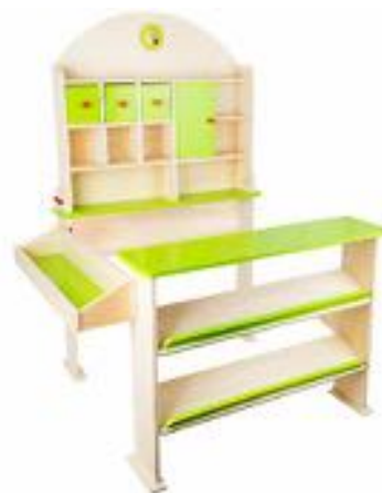
MERCADO DE MADERA REF 175-10587

Este moderno puesto de venta de madera lacada y natural tiene aún más que ofrecer a parte del amplio mostrador de venta: muchos estantes, un mostrador lateral adicional, 3 cajones, una puerta corredera y un reloj de madera ajustable para mostrar el "horario de apertura". Dimensiones: 87 x 78 x 112 cm. Altura de trabajo 56 cm. Recomendado a partir de 3 años.