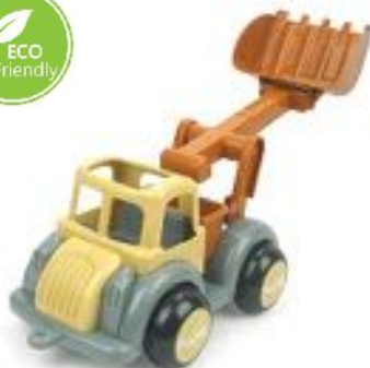
CAMIÓN DIGGER TRUCK BIO JUMBO REF 180-20-1252SP

Camión con pala excavadora, duradero y hecho de recursos renovables, fabricada 100% con biobase de caña de azúcar. Tamaño: 28 cm. Recomendado a partir de 1 año.