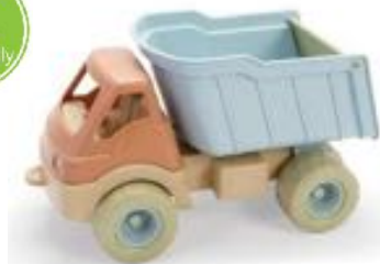
CAMIÓN DE ARENA BIO REF 231-5620

BIO camión volquete, fabricado con 90% de biobase, 100% reciclable y 100% sostenible. Medidas: 29.5 x 15 x 17 cm. Edad recomendada: a partir de 2 años.