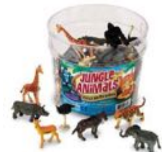
ANIMALES DE LA JUNGLA REF 137-0697

Un set de 60 figuras animales de granja de 10 especies distintas. Cubo con asa. De 3 a 7 años.