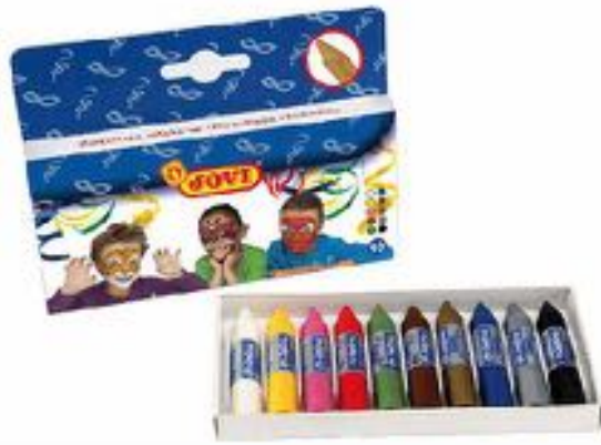
BARRA DE MAQUILLAJE 10 COLORES SURTIDOS REF 35-176