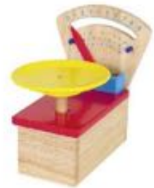
BALANZA DE MADERA REF 105-51576

Báscula de plato de madera maciza: práctica, exacta, robusta. Tamaño: 12x16x17 cm. Recomendado a partir de 3 años.