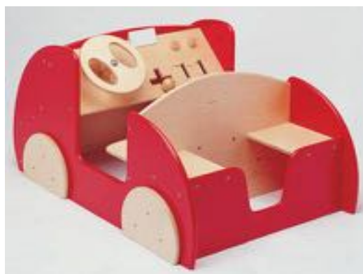
AUTOMÓVIL REF 77-370985

Carrito de jardín de 7 piezas Bosch. Incluye una podadora, una pala grande, un rastrillo, una regadera, una pala pequeña y un rastrillo de arena.