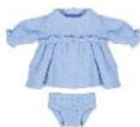
VESTIDO ENTRETIEMPO REF 1-31582