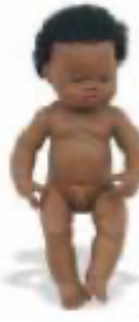
AFRICANO REF 1-31053