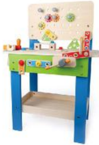
BANCO DE CARPINTERO REF 92-3000

Un banco de carpintero con numerosas herramientas: 1 abrazadera, 1 tornillo de banco, 1 llave, 1 martillo, 1 destornillador, 1 escuadra, tornillos, cuñas, tablillas de 5 formas o tamaños diferentes. Fabricado en madera. Robusto y estable. Madera natural Barnizada. Incluye 3 cajas de plástico de 3 colores para colocar los diferentes accesorios. (44 accesorios en total). Tamaño: 50x35x54 cm.. Recomendado a partir de 3 años.