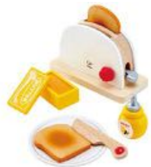
TOSTADORA REF 92-3148

Tostadora de madera. Tamaño: 26 x 20 x 10 cm. Incluye accesorios. Recomendado a partir de 2 años.