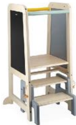
TORRE DE OBSERVACIÓN REF 186-J09640

Un gran soporte de cartón precortado, para decorar y crear fácilmente un rincón de teatro o un puesto de la compra. Un mostrador y persianas permiten muchas interacciones entre los niños. En cartón blanco recto verso precortado. Tamaño: 87 x 31 x 133 cm (montado). Entregado plano. Recomendado a partir de 3 años.