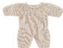
PIJAMA DE PUNTO LINO REF 1-31600