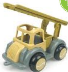
CAMION BOMBERO BIO JUMBO REF 180-20-1251SP

Camión de bomberos ecológico, duradero y hecho de recursos renovables, fabricada 100% con biobase de caña de azúcar. Tamaño: 28 cm. Recomendado a partir de 1 año.