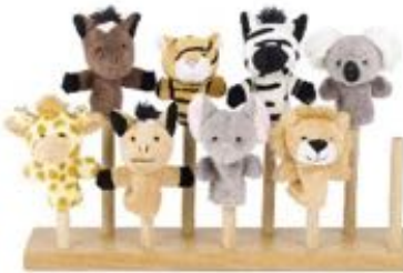
MARIONETAS DE DEDO ANIMALES SALVAJES REF 105-15125

Set de 8 marionetas de animales de bosque distintos. Con cuerpo de felpa. Medida de los títeres: 7.5 cm. aproximadamente. Edad Recomendada: A partir de 3 años.