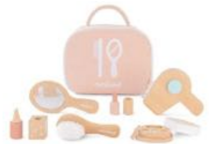
SET BELLEZA MADERA MUÑECOS REF 1-94064