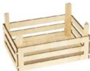
CAJA DE MADERA PARA FRUTA Y VERDURA REF 105-51600

Las monedas de juguete son ideales para enseñar el euro. El juego incluye 100 monedas de plástico mezcladas de todos los importes que simulan el reverso de diferentes países. Recomendado a partir de 3 años.