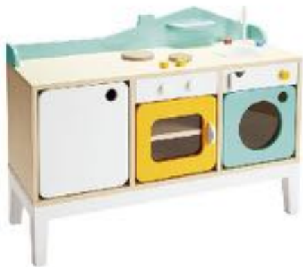
COCINA COMBINADA STUDIO REF 77-371349

Incluye 29 accesorios adicionales. Dimensiones: 79x61x105 cm.