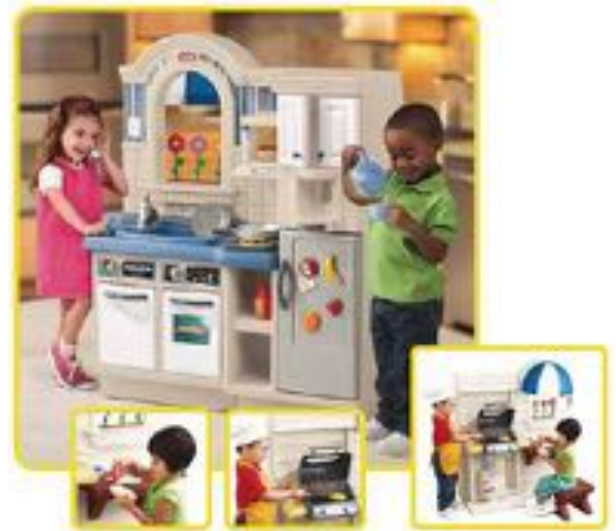
DOBLE COCINA BARBACOA INTERIOR/EXTERIOR REF 24-450B

Incluye 29 accesorios adicionales. Dimensiones: 79x61x105 cm.