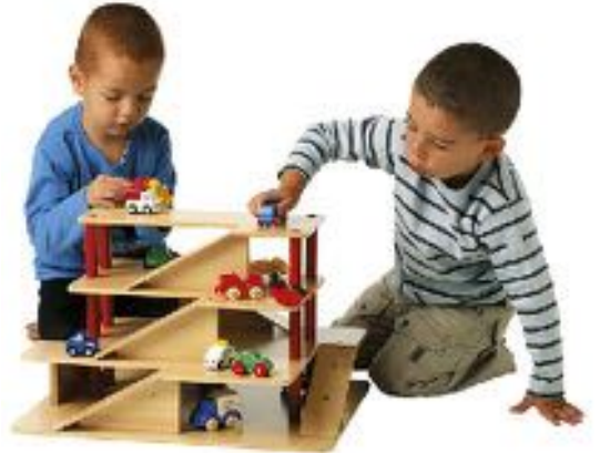
GARAJE GRANDE REF 77-371015

Camión volquete fabricado en madera maciza. El contenedor hace el movimiento de volcado completo. Tamaño: 14,5x6,5x9 cm. A partir de 2 años.