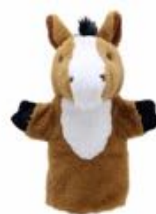
TÍTERE CABALLO REF 311-PC004617

Fabricado en un tejido muy suave. Altura: 25cm. Recomendado a partir de 18 meses.