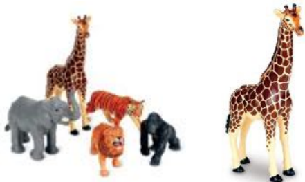
ANIMALES DE LA SELVA JUMBO REF 137-0693

Conjunto de 5 animales de la selva de gran tamaño. Fabricados en plástico de gran calidad. Medidas de la jirafa: 20x38 cm