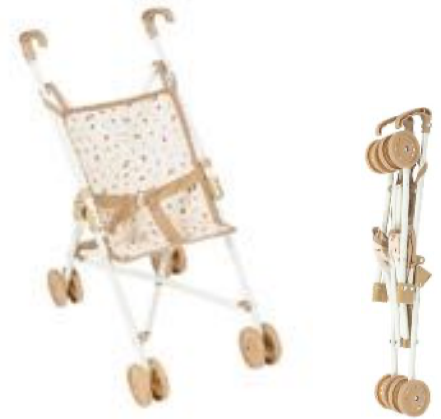
SILLA DE MUÑECAS REF 59-65170

Trona plegable con estampado vichy. Los materiales son de calidad y estructura de metal. Los peques podrán sentar a sus muñecos para darles de comer. El muñeco que puede ponerse en la trona puede medir entre 36 y 52 cm. Tela fácilmente removible para poder lavar a máquina. Medidas: Altura 27cm, Ancho 61cm. Recomendado a partir de 2 años.