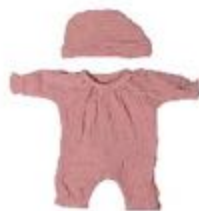
PIJAMA ROSA CON GORRO REF 1-31578