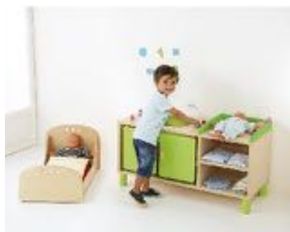
MUEBLE COMBINADO DE BAÑO CLOROFILE REF 77-372271

Un espacio de cocina completo y funcional: 1 microondas, 1 horno con fogones, 1 fregadero y 1 armario con puerta que dispone de un sistema para no pillarse los dedos. El mueble combinado de cocina se puede conectar con el Mueble combinado de lavandería Clorofile y el Mueble combinado de baño Clorofile (tornillería incluida). Pies de plástico para facilitar la limpieza. Melaminado en color abedul de 18 mm de grosor. L/a/A: 100 x 39 x 86 cm; Alt. encimera: 49 cm.