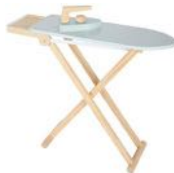
TABLA DE PLANCHAR CON PLANCHA REF 175-12480

Madera natural. Con funda de algodón extraíble. El botón de la plancha hace clic cuando lo gira. Plegable y fácil de guardar. Medidas: 56x26x55 cm. A partir de 3 años.