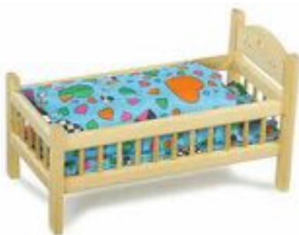
CAMA DE MUÑECAS REF 175-9601

De abedul natural, incl. juego de cama. Aprox. 26 x 44 cm.