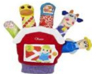
GUANTE CUENTACUENTOS REF 87-7651

Para montar en un periquete una actividad de teatro colocando el teatrillo encima de una mesa o de un mueble. Muy práctico: al terminar se cierra y en su interior se pueden guardar marionetas. Medidas: 85x56x18 cm. De madera contrachapada. Lacado naranja y azul. Telón de tela tratada azul, con barra metálica.