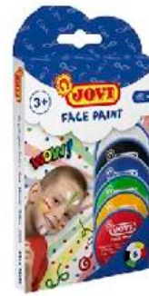
CREMA MAQUILLAJE 6 BOTES 8 ML REF 35-171