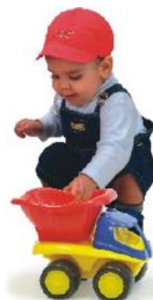
VOLQUETE REF 1-45154