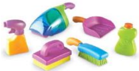
SET DE LIMPIEZA "CLEAN IT" REF 137-LER9242

Set médico de juguete que permite a los niños jugar a ser profesionales de la salud, desarrollando habilidades cognitivas y emocionales. Incluye 8 utensilios esenciales y un maletín para guardarlos. Recomendado a partir de 3 años.