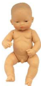
ASIATICO REF 1-31035

Realizados en vinilo, suave textura, alta resistencia y flexibles. Cabeza, brazos y piernas articulados. Permiten la posibilidad de ser lavados y bañados, ya que sus articulaciones son herméticas. Con agradable perfume, sexo y representando cuatro razas diferentes.