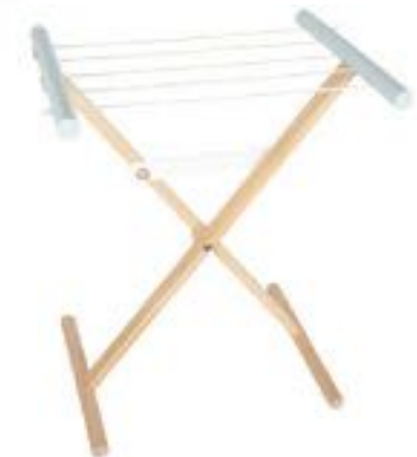
TENDEDERO MADERA REF 175-12479

Plegable y con pestillo de seguridad para un soporte estable. Dimensiones: 49x34x63 cm. Recomendado a partir de 3 años.