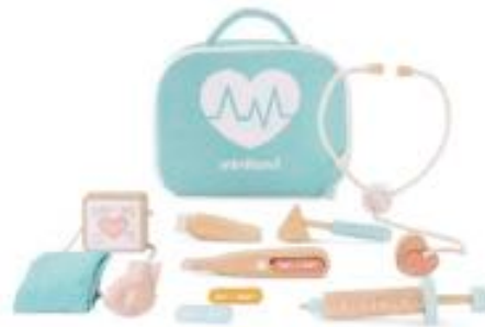
SET MÉDICO MADERA MUÑECOS REF 1-94063

Silla de ruedas para muñecos y muñecas de hasta 38cm. Fabricada en madera certificada FSC, ecológica, respetuosa con el medioambiente. Recomendado a partir de 18 meses.