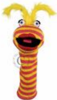
MARIONETA CALZETINES PINTALABIOS REF 311-PC007024

Marioneta de punto con forma de calcetín y chirriador en la lengua, ideal para fomentar la imaginación y el juego. Dimensiones: 38 cm de altura, 14 cm de anchura, 13 cm de longitud. Apta para niños a partir de 18 meses.