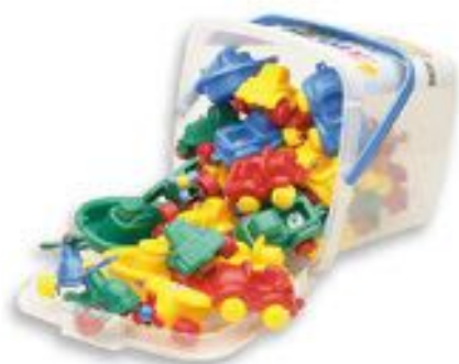
SET MINI CHUBBIES RUEDA DURA REF 180-241490

Fabricados en plástico flexible y robusto a la vez, y con ruedas muy seguras, no extraíbles. Ejes de alta resistencia para resistir todos los esfuerzos a los que los someten los más pequeños. Incluye: Bote con 9 piezas de unos 9 cms cada una. A partir de 18 meses.