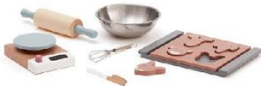
SET DE PASTELERIA REF 318-1000271