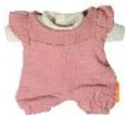
PETO Y CAMISETA ENTRETIEMPO REF 1-31576