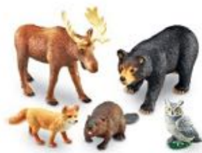
ANIMALES DEL BOSQUE JUMBO REF 137-0787

Conjunto de 5 animales del bosque de gran tamaño. Fabricados en plástico de gran calidad. Medidas del alce: 22x19 cm