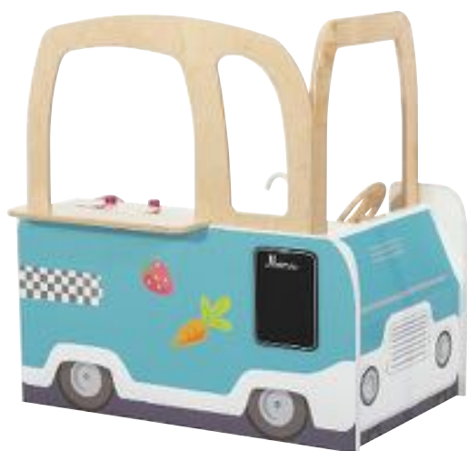
FOOD TRUCK REF 77-372922

Un mando giratorio con sonido de clic en la plancha garantiza un juego de rol más realista. La tabla de planchar puede colocarse en dos alturas diferentes y adaptarse así individualmente al tamaño del niño. Dimensiones: 66x19x55 cm, Altura aprox. 55/59 cm, Plancha aprox. 16x8x8 cm. Recomendado a partir de 3 años.