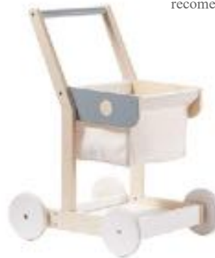
CARRITO DE LA COMPRA REF 318-1000273

Con esta balanza se pueden pesar productos de los puestos de mercado incluye platos de metal. Tamaño del artículo: 30 x 10 x 31 cm. Cantidad de piezas: 7. A partir de 3 años.