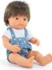
MUÑECO EUROPEO CASTAÑO CON ROPA REF 1-33209