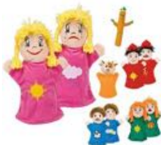
MARIONETAS DE EMOCIONES REF 13-64001

Set de 6 marionetas (4 de ellas reversibles con 2 caras diferentes) con un CD audio MP3 que contiene la grabación completa, con música y diálogos, de 2 cuentos. La representación de los cuentos con las marionetas permite a los niños descubrir las emociones. El CD audio MP3 incluye libreto con los textos de los cuentos y guía pedagógica con actividades para trabajar las emociones. La duración aproximada de cada cuento es de 10 minutos.