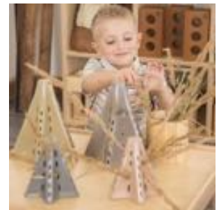
CONOS APILABLES ECO 20UD REF 234-EY11876

10 conos grandes que miden 22x20x19 cm. 10 conos pequeños que miden 14x14x13 cm. 4 colores en diferentes tonos de marrón.