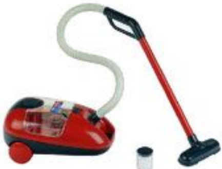
ASPIRADORA VILEDA REF 27-6719

El Set incluye 6 piezas: un recogedor y un cepillo de juguete, una botella que simula producto de limpieza, botella de spray, aspiradora de mano y esponja de limpieza. La aspiradora de mano (juguete más grande) mide 18 cm. Recomendado de 2 a 5 años.