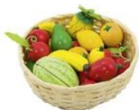
CESTA DE FRUTAS REF 105-51661

Cesta con frutas de madera. Incluye: 23 piezas. Ideal para equipar el puesto de mercado. A partir de 3 años.