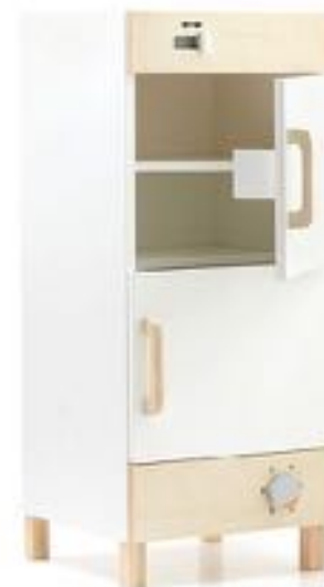
NEVERA REF 318-1000281

Preciosa nevera y congelador de madera, el juguete ideal para hacer ricas comilonas con la familia y muñecos. Medida: 30 x 30 x 73cm.