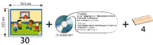
ACTITUDES POSITIVAS: AFECTO, SALUD Y SEGURIDAD REF 13-20811

7 sencillas historias, que narran dos formas diferentes de resolver conflictos, mostrando las consecuencias de tomar una buena o una mala decisión. Sistema autocorrector. Para niños de 3 a 6 años.