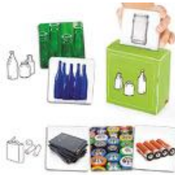
SEPARAR Y RECICLAR REF 13-20552

Set de 4 puzzles de madera que muestran la importancia de un desarrollo sostenible para conservar el planeta. Cada puzzle mide 29,5x22 cm. Hay 2 puzzles de 24 piezas y 2 puzzles de 35 piezas. Recomendado de 4 a 7 años.