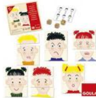
JUEGO DE EXPRESIONES REF 59-51351

Aprende nuevas habilidades de aprendizaje socioemocional con estas fichas llenas de sentimientos. El juego de 36 fichas incluye 6 emociones y 6 colores brillantes: ¡ayuda a los niños a hablar sobre la felicidad, la tristeza, la sorpresa, el enojo y más! Los contadores también están listos para clasificar, emparejar y contar. Recomendado a partir de 3 años.