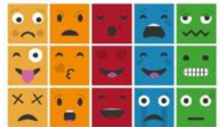
LOSETAS EMOCIONES REF 267-11422

Juego de 15 Losas de emociones. La forma perfecta de aprender las emociones con diversión. Guía del maestro incluida. Tamaño de las losetas: 29 x 29 cm.