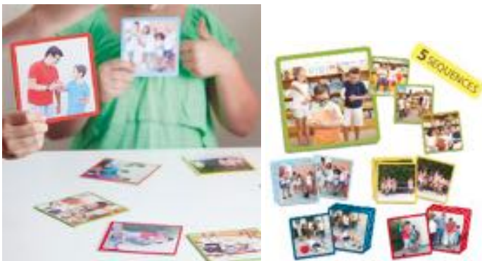
EDUCAR CONTRA EL ACOSO ESCOLAR REF 13-20840

Juegos de asociación de parejas, que muestran un buen y un mal comportamiento, en diferentes situaciones del entorno cotidiano del niño. 34 fichas autocorrectoras. Para niños de 3 a 7 años.