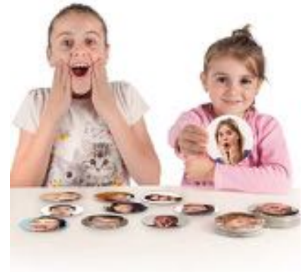
RECONOCER Y GUIAR LAS EMOCIONES REF 13-20545

35 fichas redondas de 9 cm de diámetro. Jugar a descubrir las emociones es el paso previo para empezar a desarrollar la conciencia emocional, alcanzar un mayor autocontrol y una adecuada regulación emocional. Sirve para aprender a identificar las emociones en uno mismo, reconocerlas en los demás, y tomar decisiones sobre nuestro comportamiento. Juego para aprender a reconocer, a partir de expresiones y gestos, las 10 emociones básicas* que guían nuestro comportamiento. Permite nombrarlas, clasificarlas en agradables y desagradables, y ordenarlas según su intensidad. Para niños de 2 a 8 años.