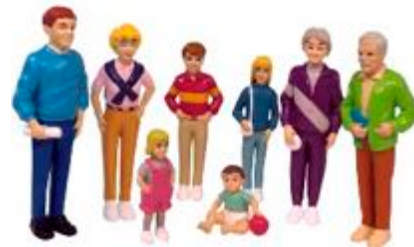
FAMILIA EUROPEA REF 1-27395