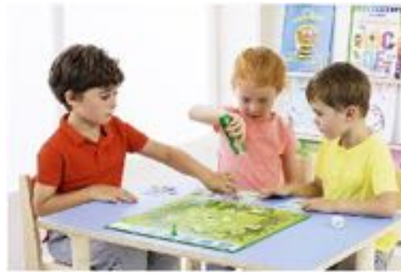
NUESTRO OBJETIVO: LIMPIAR EL BOSQUE REF 77-379076

Juegos de lenguaje y observación para descubrir 6 entornos naturales: el huerto, el campo, el estanque, el río, la orilla del mar y el fondo marino. A partir de las láminas ilustradas, los niños aprenden a diferenciar los paisajes, a reconocer y memorizar especies de animales y vegetales, a crear comparaciones entre los medios de vida, a enriquecer su vocabulario, etc. Cada lámina representa lo que podemos ver por encima / sobre / por debajo. El juego de loto anima a los niños a detectar referencias y a "buscar al animalito" para completar cada lámina. L/a de la lámina: 33 x 23 cm; lateral de la ficha: 7 cm. La caja contiene: 6 láminas de actividades de cartón, 48 fichas de animales de cartón y 1 guía didáctica. Recomendado para niños a partir de 4 años.