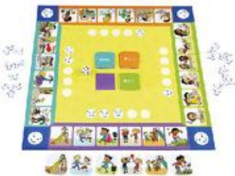
BUENAS MANERAS EN EL COLEGIO REF 77-332013

Puzles de dos piezas para fomentar en los más pequeños una educación inclusiva y no sexista, con niñas y niños que realizan diferentes actividades por igual. 18 puzles silueteados, de cartón resistente, formados por dos piezas de gran tamaño (17 x 8,5 cm). Edad recomendada: 2 a 5 años.