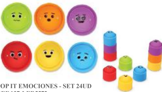
POP IT EMOCIONES - SET 24UD REF 137-LER5572

Diseñada para ayudar a los niños a expresarse sobre sus emociones y entenderlas mejor, con el fin de desarrollar la autoestima, el apoyo mutuo y el compartir dentro de un grupo. El profesor es guiado para conectar las actividades de lenguaje, escucha y expresión (mímica, dibujo).