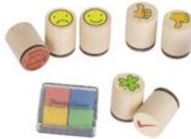
SELLOS DE EVALUACIÓN ESCOLAR REF 105-15532

Set con 10 maxi-sellos de madera para jugar y representar las 10 emociones básicas que guían nuestro comportamiento: alegría, seguridad, admiración, curiosidad, sorpresa, ira, asco, tristeza, miedo y culpa. El niño puede identificar y expresar sus emociones. Aptos para cualquier tinta. 4 cm de diámetro y 3,5 cm de altura. Recomendado para niños de 3 a 8 años.