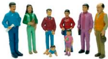
FAMILIA LATINOAMERICANA REF 1-27398