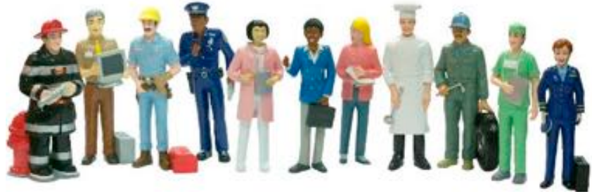
FIGURAS DE OFICIOS REF 1-27388

Set de 9 muñecos y muñecas para formar y recrear diferentes familias. Ayuda a familiarizarse con la diversidad y el respeto, fomentando valores de tolerancia, empatía e igualdad entre personas. Todas las piezas están pintadas cuidadosamente a mano. Recomendado a partir de 2 años.