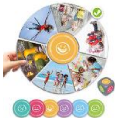
EMOTIONAL SITUATIONS. ¿COMO TE SENTIRÍAS SI...? REF 13-20548

Juego de 15 Losas de emociones. La forma perfecta de aprender las emociones con diversión. Guía del maestro incluida. Tamaño de las losetas: 29 x 29 cm.