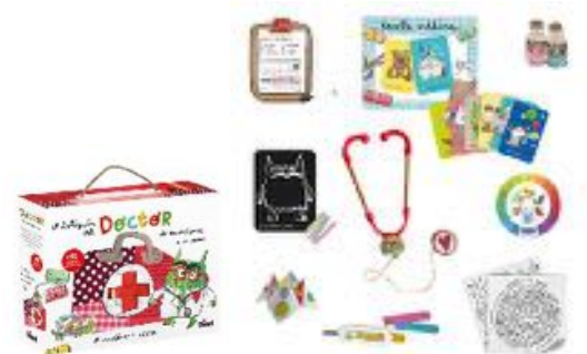
EL BOTIQUÍN DOCTOR DE LAS EMOCIONES REF 10-1120200281

4 juegos en 1 para descubrir las expresiones faciales y reflexionar sobre su significado por sí mismos y con los demás. Los niños aprenden a reconocer, nombrar, interpretar y reproducir 6 expresiones faciales: la sonrisa, la risa, la tristeza, la cólera, la aversión y la sorpresa. De este modo, enriquecen su vocabulario y se mentalizan de que la cara es un elemento esencial de la expresión y la comunicación no verbal. Juego del lenguaje: las láminas de fotos son el punto de partida de numerosas actividades de observación, descripción, comparación, adivinanzas, mímica, etc. Juego de clasificación: clasificar las fotos por la expresión y asociarlas a las fichas con símbolos correspondientes; clasificar por el tipo de sensación (disfrute/disgusto). Juegos de loto: loto de 1 expresión o bingo de 6 expresiones. La caja contiene: 30 láminas de fotos de cartón (18 x 24 cm), 6 fichas de cartón ilustradas con «expresiones» (Ø: 6 cm), 6 láminas de loto de cartón por ambas caras (18 x 24 cm), 30 tarjetas de cartón con fotos (6 x 8 cm) y 1 guía didáctica. Recomendado para niños a partir de 3 años.