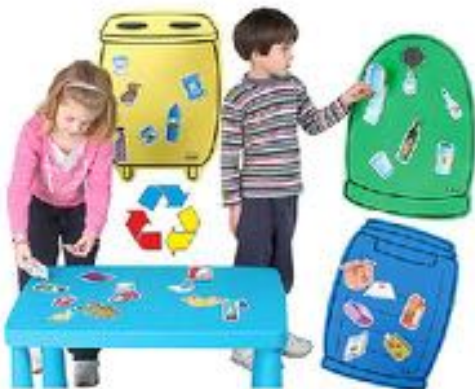
¡RECICLA TÚ! REF 12-849

Tres contenedores con 36 piezas de consumibles reciclables para colocar cada uno en su contenedor: envases, vidrio o papel. Todo realizado en plástico de primera calidad. Tarjetas: 7x12 cms. Contenedores: 62x48 cms.