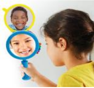
ESPEJOS REFLEJO DE EMOCIONES REF 137-LER91293

Set de 4 Espejos. Con ellos los niños podrán observar y aprender a identificar las emociones en ellos mismos y en los demás. Espejo y seis fotos de niños reales que expresan emociones reales: felicidad, sorpresa, miedo, tristeza, tontería y rabia. El espejo está hecho de vidrio de alta calidad, duradero y adecuado para los niños. Mide 20x10 cm. Recomendado de 3 a 7 años.