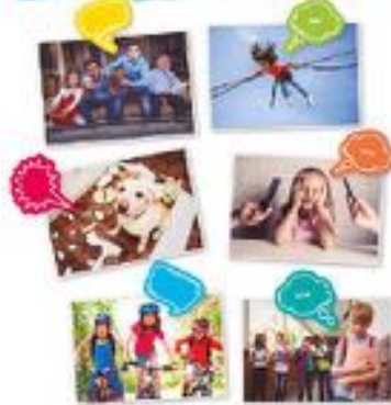
ADIVINA QUÉ ESTÁN PENSANDO REF 13-20514

Juego para observar las diferentes imágenes y ponerse en el lugar de los personajes y adivinar qué están pensando. Utilizado para trabajar con alumnos y niños que tienen necesidades especiales. Mejora las habilidades sociales, la comunicación y la empatía. Incluye 54 fotografías y 22 globos de diálogo para rellenar y expresar que piensan los personajes. Recomendado a partir de 3 años. También se puede trabajar con adultos senior.