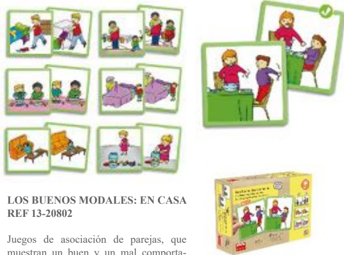
LOS BUENOS MODALES: EN CASA REF 13-20802

Observa las 4 imágenes de cada tablero y descarta con la cruz la actitud incorrecta. Para trabajar valores de afecto, salud y seguridad. 12 fichas autocorrectoras y 12 "X". Para niños de 3 a 6 años.