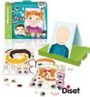
MAGNETICS: EXPRESIONES REF 10-63247

Juego magnético para combinar las piezas de la cara y representar las diferentes emociones. Se juega sobre un escenario extraíble que se encaja en la base de la caja. El niño deberá crear rostros combinando tres piezas intercambiables. Cada pieza refleja características y estados de ánimo diferentes, lo cual permite crear múltiples combinaciones. Recomendado a partir de 3 años.