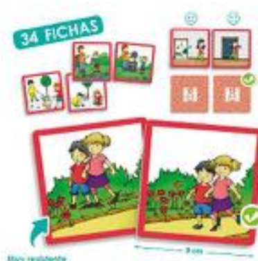
LOS BUENOS MODALES: EL MEDIOAMBIENTE REF 13-20800

Tres contenedores con 36 piezas de consumibles reciclables para colocar cada uno en su contenedor: envases, vidrio o papel. Todo realizado en plástico de primera calidad. Tarjetas: 7x12 cms. Contenedores: 62x48 cms.