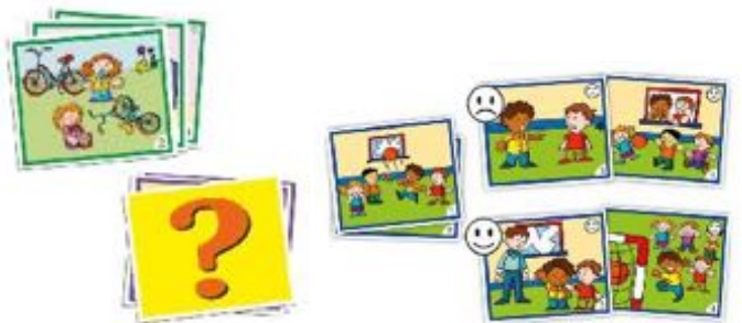
SOLUCIÓN DE CONFLICTOS: LAS MENTIRAS REF 13-20832

Set de 5 secuencias que permiten educar y concienciar a los más pequeños para prevenir situaciones de acoso escolar antes de que existan, así como dotarles de estrategias para afrontarlas. 20 tarjetas de 11,5x11,5 cm. Recomendado para niños de 4 a 8 años.