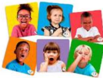
SET 6 PUZZLES LAS EMOCIONES REF 1-35270

Ayuda a los niños a desarrollar importantes habilidades socioemocionales con este conjunto de actividades que les enseña sobre los sentimientos y emociones en ellos mismos y en los demás con 10 actividades interesantes. Contenido: dos cubos con preguntas, cuatro cubos de plástico de personajes, 12 tarjetas de personajes, 18 tarjetas de situación, un póster y una guía didáctica. Recomendado a partir de 3 años.