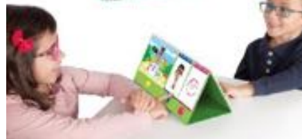
PONTE EN MI LUGAR REF 13-20845

Observa las diferentes situaciones, ponte en el lugar de los personajes y describe cómo se sienten. Favorece el desarrollo de habilidades sociales como la empatía, la identificación de las emociones y ayuda a desarrollar la conciencia emocional. Incluye: 10 escenas, 15 personajes y 10 emociones. Recomendado para niños con necesidades especiales. Tamaño: 31 x 15 cm. Edad recomendada: de 3 a 8 años.