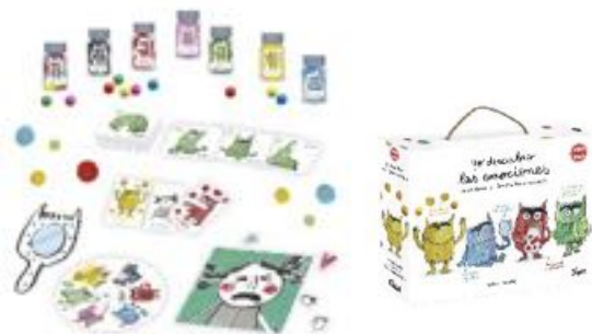
YO DESCUBRO LAS EMOCIONES REF 10-41207

Juego de detectives para dialogar sobre conflictos cotidianos. Potencia la expresión y la gestión de sentimientos interpretando cómo se sienten los personajes. Favorece la empatía. El efecto "mágico" de la lupa permite descubrir una posible solución. Contenido: 24 tarjetas, 18 estrellas, 1 ruleta, 1 lupa y 1 folleto. Anchura 28 cm. Altura 12 cm. Recomendado para niños de 3 a 6 años.