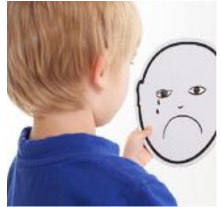
EMOTIBLOCKS REF 1-32350

Set de personajes con piezas intercambiables que permiten crear libremente simpáticos personajes. Hay más de 100 combinaciones posibles. Acompañados de fichas de actividades, es un divertido recurso para familiarizarse con las principales emociones. Contenido: 6 personajes, 6 fichas de emociones y 1 folleto. Personajes: 12 cm alto. Recomendado para niños de 2 a 6 años.