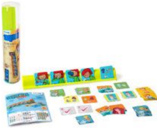
SECUENCIAS HÁBITOS DE HIGIENE REF 1-31968

Tarjetas para organizar de forma secuencial diferentes momentos relacionados con la higiene cotidiana. Desarrollan el pensamiento lógico y la expresión verbal, además permiten reforzar y consolidar los hábitos e ir adquiriendo autonomía personal. Peana: 36 x 4,5x 5,5 cm. Tarjetas: 5 x 5 cm. Contenido: 1 peana, 36 tarjetas de plástico y 1 guía pedagógica. Recomendado para niños de 3 a 6 años.