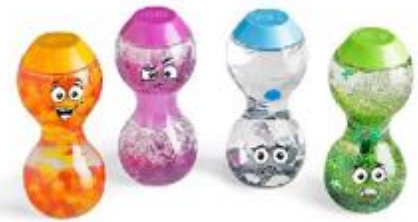
BOTELLAS SENSORIALES 4 PIEZAS REF 137-96242

Este set de 4 botellas sensoriales ayuda a los niños a identificar y gestionar sus emociones a través del juego. Cada botella representa una emoción con colores y elementos interactivos únicos: Amor, Sorpresa, Vergüenza y Diversión. Diseñadas para un agarre fácil y seguras para los niños. Edad recomendada: a partir de 3 años.