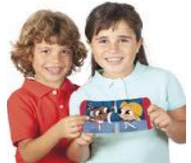
JUGAMOS EN IGUALDAD REF 13-20839

Puzles de dos piezas para fomentar en los más pequeños una educación inclusiva y no sexista, con niñas y niños que realizan diferentes actividades por igual. 18 puzles silueteados, de cartón resistente, formados por dos piezas de gran tamaño (17 x 8,5 cm). Edad recomendada: 2 a 5 años.