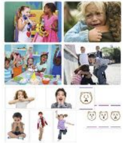
LAS EMOCIONES REF 77-343002

Set de 6 puzzles para niños y niñas para trabajar el reconocimiento de los gestos faciales y las emociones básicas. Cada uno de sus seis puzzles representa una de las emociones básicas. Los niños y niñas aprenderán a reconocerlas mientras construyen el puzzle, dando forma a la emoción. Contenido: 6 puzzles de 25 piezas. Medidas: 21 x 21 cm. Recomendado a partir de 3 años.