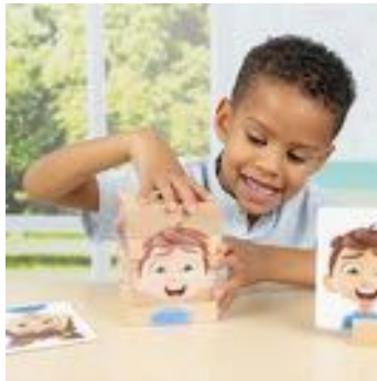
MIX & MATCH - LAS EMOCIONES REF 77-911764 PVP: 37,00 €

Material manipulativo que ayuda a los niños aprender, identificar y gestionar las distintas emociones. Además de desarrollar la capacidad de reconocer los sentimientos, comprenderlos y expresarlos, y a través del lenguaje verbal y no verbal, resolución de conflictos... Contenido: 20 cartas de las emociones, 10 cartas con situaciones, 30 fichas con elementos que ayuden a los niños a hablar de las emociones, póster de las emociones, dado y comecocos. Recomendado de 4 a 7 años.