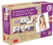
MAXI-SECUENCIAS DE HÁBITOS DIARIOS REF 13-30639

Actividad que busca desarrollar la autonomía en los niños y en aquellos niños con necesidades especiales. A través de 5 secuencias de 4 pasos cada una, en donde se ilustran hábitos diarios básicos de higiene, autonomía y colaboración en las tareas del hogar. Edad recomendada: De 3 a 8 años.