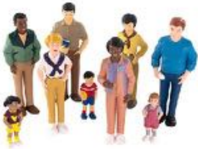
FAMILIAS DEL MUNDO DIVERSAS REF 1-27390

Set de 9 muñecos y muñecas para formar y recrear diferentes familias. Ayuda a familiarizarse con la diversidad y el respeto, fomentando valores de tolerancia, empatía e igualdad entre personas. Todas las piezas están pintadas cuidadosamente a mano. Recomendado a partir de 2 años.