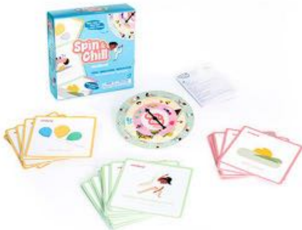
SPIN & CHILL: JUEGO DE RELAJACIÓN REF 1-31899

Juego interactivo para que los niños practiquen yoga, mindfulness y relajación de forma divertida. Incluye 24 tarjetas ilustradas y una ruleta que guía actividades para fomentar la calma, concentración y bienestar emocional. Adaptado a cada etapa infantil, ayuda a gestionar emociones y desarrollar habilidades de autorregulación. Recomendado a partir de 2 años.