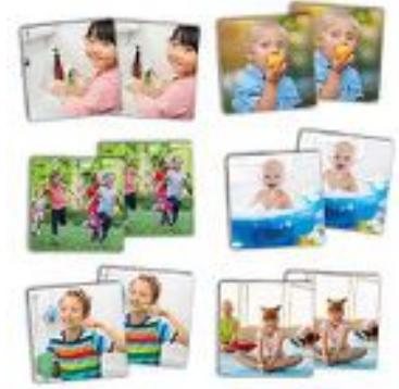
MAXI-MEMORY HIGIENE Y SALUD REF 13-20408

Imágenes reales en fichas de gran tamaño para descubrir y fomentar hábitos saludables de higiene, al mismo tiempo que desarrollas la atención y ejercitas la memoria. Incluye: 34 fichas de cartón resistente con imágenes reales (9 x 9 cm). Edad recomendada: 3 a 8 años