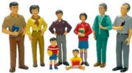
FAMILIA ASIÁTICA REF 1-27397