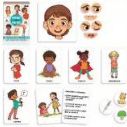
APRENDO EN POSITIVO: EMOCIONES REF 10-41201

10 originales actividades para descubrir, nombrar y dominar las diferentes emociones; como por ejemplo la ira, el miedo, la tristeza, la serenidad, la alegría y el amor. El juego viene acompañado de una "Guía de las emociones". Basado en el libro "El Monstruo de las emociones" de Anna Llenas. Edades: entre 3 y 6 años.