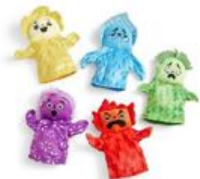
MARIONETAS DE MANO EMOCIONES REF 137-95417

Alegres, tristes, sorprendidas, enfadadas o asustadas, estas 5 coloridas marionetas de mano para niños ayudan a los más pequeños a explorar los sentimientos y las emociones a través del juego guiado o libre, o de actividades de narración. El pelo de las marionetas alegre, enfadada y triste emite un sonido crujiente que añade una dimensión adicional al juego sensorial. Recomendado a partir de 18 meses.