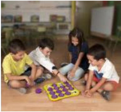
MEMO GAME: EDUCACIÓN EN VALORES REF 1-31925

Serie de 12 láminas tematizadas para la educación en valores: igualdad de género, tolerancia, respeto, buenas conductas, etc. Con divertidas ilustraciones a todo color y atractivas fotografías. Contenido: 1 bandeja con tapa, 16 tapas, 4 fichas y 1 folleto. Dimensiones: 33x33 cm. Recomendado para niños de 3 a 6 años.