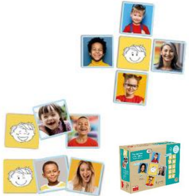
LAS EXPRESIONES REF 13-20542

Juego para aprender a identificar iconos de expresiones faciales, y asociarlos con imágenes de expresiones reales. 50 fichas autocorrectoras. Para niños de 3 a 6 años.