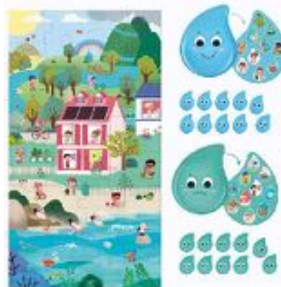
CUIDANDO EL PLANETA: EL AGUA REF 10-1120200189

Cuidando el planeta: Los Alimentos es un juego educativo que fomenta el respeto por el entorno y la valoración de la diversidad de los alimentos. Incluye 50 fichas de alimentos, cada una con un color que corresponde a la estación del año, y un sistema autocorrectivo para que los niños verifiquen sus respuestas. Además, cuenta con un puzzle de estaciones y 7 tarjetas con recetas para diferentes modalidades de juego. Recomendado a partir de 4 años.