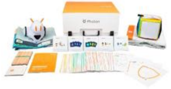
PHOTON SOCIAL EMOTIONAL LEARNING REF 338-PHOTSEL

Pizarra de doble cara y 2 láminas de piezas magnéticas para crear diferentes caras y expresiones. A partir de 3 años.