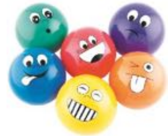
PELOTAS DE EMOCIONES PEQUEÑAS REF 50-M440125

Pack de 6 bolas con distintos colores y emociones. Cada bola tiene 20 cm de diámetro.