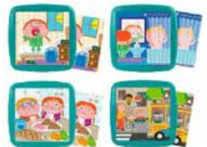
SET 4 PUZZLES HABITOS DIARIOS REF 1-36206

Descubre la diversidad que existe en el cole, en casa y en la vida para reflexionar acerca de valores de respeto, tolerancia, cooperación, integración, colaboración y solidaridad. Este memory de inclusión social con imágenes reales nos muestra un mundo más inclusivo y promueve valores que fomentan la paz. Recomendado a partir de 3 años.