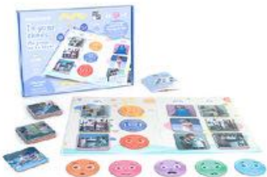
ME PONGO EN TU LUGAR: JUEGO PARA RECONOCER LAS EMOCIONES REF 1-45415

Alegres, tristes, sorprendidas, enfadadas o asustadas, estas 5 coloridas marionetas de mano para niños ayudan a los más pequeños a explorar los sentimientos y las emociones a través del juego guiado o libre, o de actividades de narración. El pelo de las marionetas alegre, enfadada y triste emite un sonido crujiente que añade una dimensión adicional al juego sensorial. Recomendado a partir de 18 meses.