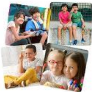
SET 4 PUZZLES APRENDE VALORES REF 1-35271

Retos para desarrollar diferentes tipos de inteligencia y conocer los puntos fuertes de cada persona. Inspirado en la Teoría de Howard Gardner y permite trabajar las 8 inteligencias de su modelo. Incluye 64 fichas o retos. Con un maletín para guardar. Medidas de cada ficha: 9,2 x 9,2 cm.