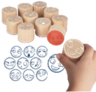
MAXI SELLOS DE LAS 10 EMOCIONES REF 13-20546

Cada botella tiene un diseño único con su propia expresión facial, color y elemento interactivo en el interior que encarna ese sentimiento. Observar el movimiento también puede ayudar a los niños a calmarse y concentrarse. Contenido: 4 botellas sensoriales únicas (excitado, impaciente, solitario y nervioso). Recomendado a partir de 3 años.