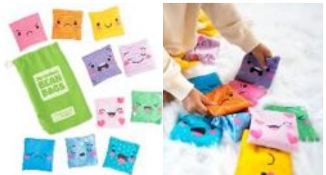
BEAN BAGS MIS SENTIMIENTOS REF 137-EI3043

Almohadillas para empapar los sellos en tintas de colores. Incluye 7 colores: Un tampón grande de color negro y 6 almohadillas más pequeñas.