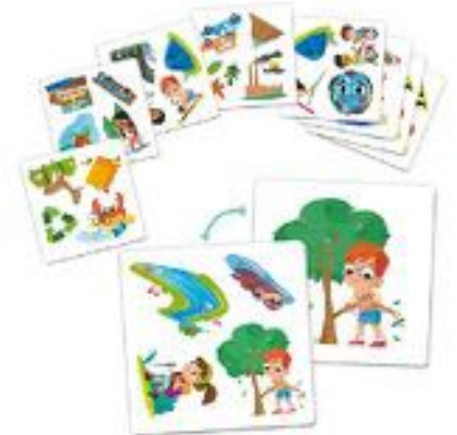
CUIDANDO EL PLANETA: PEQUEÑAS ACCIONES REF 10-1120200187

Juego educativo con el que aprenderán a ser cuidadosos con el agua y hacer un buen uso de ella. También aprenderán a diferenciar las buenas y las malas acciones con diferentes modalidades de juego. Recomendado a partir de 3 años.