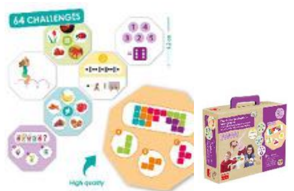
RETO DE INTELIGENCIAS MÚLTIPLES REF 13-20005

Retos para desarrollar diferentes tipos de inteligencia y conocer los puntos fuertes de cada persona. Inspirado en la Teoría de Howard Gardner y permite trabajar las 8 inteligencias de su modelo. Incluye 64 fichas o retos. Con un maletín para guardar. Medidas de cada ficha: 9,2 x 9,2 cm.