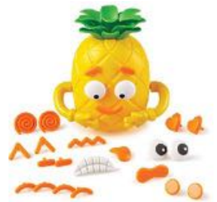
PIÑA DE LAS EMOCIONES REF 137-LER6373

Set de puzzles 10 emociones, busca que los niños conecten las emociones, las reconozcan y aprendan sobre ellas. Alegría, seguridad, admiración, curiosidad, sorpresa, ira, asco, tristeza, miedo y culpa, son las emociones con la que los niños comenzarán a relacionarse y trabajar. Edad recomendada: De 2 a 6 años.