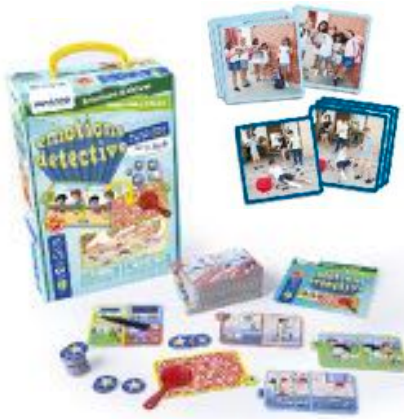
EMOTIONS DETECTIVE REF 1-45402

Set de 4 Espejos. Con ellos los niños podrán observar y aprender a identificar las emociones en ellos mismos y en los demás. Espejo y seis fotos de niños reales que expresan emociones reales: felicidad, sorpresa, miedo, tristeza, tontería y rabia. El espejo está hecho de vidrio de alta calidad, duradero y adecuado para los niños. Mide 20x10 cm. Recomendado de 3 a 7 años.