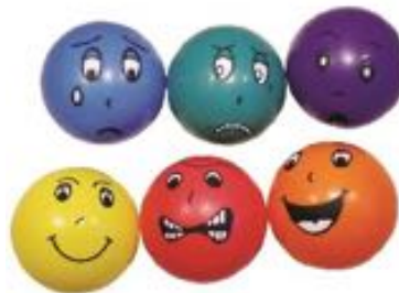
PELOTAS DE EMOCIONES REF 50-M440137

Pack de 6 pelotas perfumadas fabricadas en PVC que representan expresiones faciales. Diámetro: 25 cm.