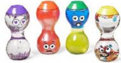
BOTELLAS SENSORIALES SENTIMIENTOS REF 137-96949

Este set de 4 botellas sensoriales ayuda a los niños a identificar y gestionar sus emociones a través del juego. Cada botella representa una emoción con colores y elementos interactivos únicos: Amor, Sorpresa, Vergüenza y Diversión. Diseñadas para un agarre fácil y seguras para los niños. Edad recomendada: a partir de 3 años.