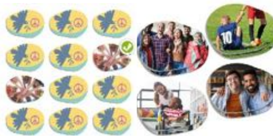
INCLUSIÓN SOCIAL: ESCUELA, FAMILIA Y PAZ REF 13-20844

Set de 4 puzzles ideal para el aprendizaje en valores: tolerancia, empatía, diversidad... Mientras los niños y niñas forman cada puzzle, aprenderán sobre los valores representados en sus imágenes. Contenido: 4 puzzles de 25 piezas. Medidas: 21 x 21 cm. Recomendado a partir de 3 años.