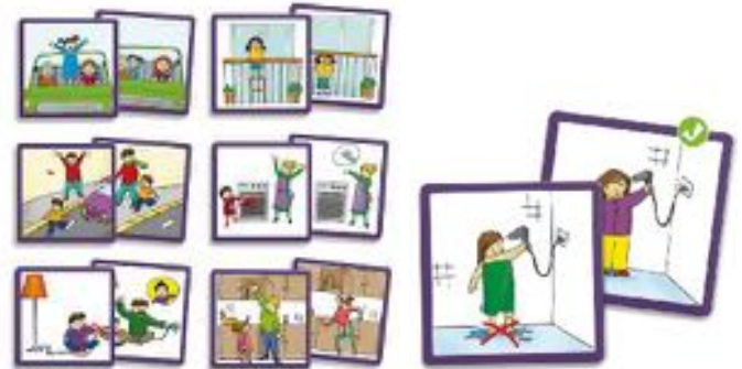
LOS BUENOS MODALES: PRECAUCIÓN Y SEGURIDAD REF 13-20803

Juegos de asociación de parejas, que muestran un buen y un mal comportamiento, en diferentes situaciones del entorno cotidiano del niño. 34 fichas autocorrectoras. Para niños de 3 a 7 años.