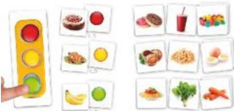
EL SEMAFORO DE LA BUENA ALIMENTACION REF 13-20553

Juego de asociación para aprender a relacionar alimentos básicos con los colores del semáforo, en base a la frecuencia con que se deben tomar dichos alimentos, siendo el verde a menudo, el ámbar a veces y el rojo ocasionalmente. Incluye 6 semáforos (7 x 18 cm) + 54 alimentos (7 x 7 cm) + fichas de colores (verde, ámbar y rojo) para rellenar los semáforos. Recomendado a partir de 4 años.