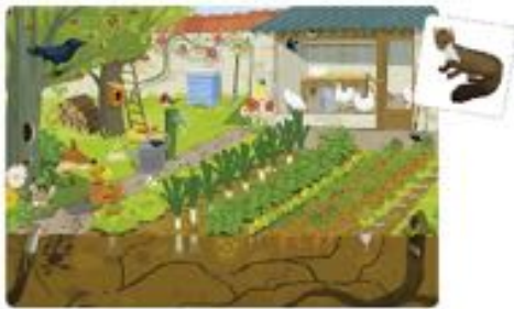
JUEGOS DE LA NATURALEZA REF 77-336198

Juegos de lenguaje y observación para descubrir 6 entornos naturales: el huerto, el campo, el estanque, el río, la orilla del mar y el fondo marino. A partir de las láminas ilustradas, los niños aprenden a diferenciar los paisajes, a reconocer y memorizar especies de animales y vegetales, a crear comparaciones entre los medios de vida, a enriquecer su vocabulario, etc. Cada lámina representa lo que podemos ver por encima / sobre / por debajo. El juego de loto anima a los niños a detectar referencias y a "buscar al animalito" para completar cada lámina. L/a de la lámina: 33 x 23 cm; lateral de la ficha: 7 cm. La caja contiene: 6 láminas de actividades de cartón, 48 fichas de animales de cartón y 1 guía didáctica. Recomendado para niños a partir de 4 años.