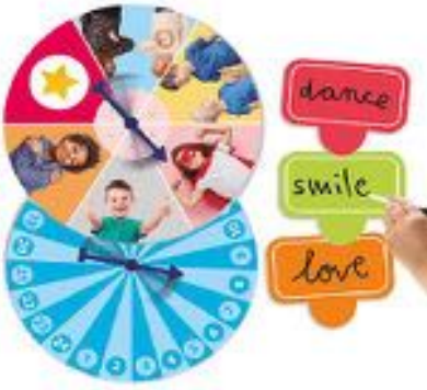
LA RULETA DE LA AUTOESTIMA REF 13-20846

Permite aumentar el autoconcepto de niñas y niños de forma dinámica, divertida, positiva y enriquecedora. Incluye: 3 ruletas de cartón resistente (18 cm), 24 tarjetas reescribibles de cartón resistente (10 x 8 cm), 24 fichas circulares de cartón resistente (3 cm) y 12 rotuladores borrables. Edad recomendada: 4 a 8 años.