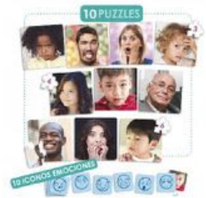
SET PUZZLE 10 EMOCIONES REF 13-20544

Juego educativo para prevenir el acoso escolar a través de la empatía y el diálogo. Incluye 10 puzzles, 8 caritas de emociones, una guía y un folleto para ayudar a los niños a reconocer sentimientos y fomentar el trabajo en equipo. Desarrollado en colaboración con la Fundación Anar. Recomendado a partir de 2 años.