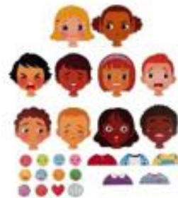
MAGNETIBOOK EMOCIONES REF 186-J08038

Fabricado en madera. Incluye 15 Piezas y 3 Dados. Edad Recomendada: de 3 a 6 años.