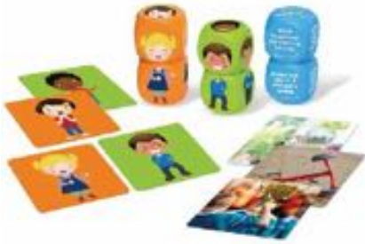
ACTIVIDADES PARA APRENDER SOBRE LOS SENTIMIENTOS REF 137-92868

Ayuda a los niños a desarrollar importantes habilidades socioemocionales con este conjunto de actividades que les enseña sobre los sentimientos y emociones en ellos mismos y en los demás con 10 actividades interesantes. Contenido: dos cubos con preguntas, cuatro cubos de plástico de personajes, 12 tarjetas de personajes, 18 tarjetas de situación, un póster y una guía didáctica. Recomendado a partir de 3 años.