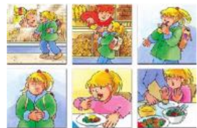
TÚ DECIDES REF 287-L12075

12 historias ilustradas en colores describen historias cotidianas, pero también emocionantes, y cada una tiene dos posibles soluciones (azul o rojo) para elegir. Contenido: 12 historias de colores, cada una con 5-7 imágenes, un total de 72 tarjetas, formato 9 x 9 cm. Con instrucciones.