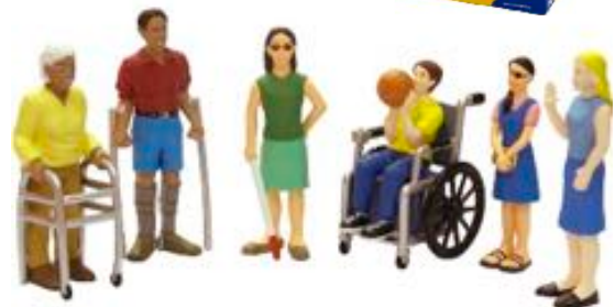
FIGURAS DE DISCAPACIDADES REF 1-27389