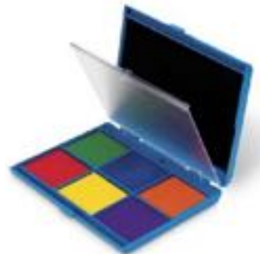
PALETA 7 COLORES PARA SELLOS REF 137-4275

Set de 7 sellos escolares para evaluar los trabajos de los alumnos. Incluye 4 colores. Fabricados en madera. Diámetro: 2,2 cm. Edad recomendada: A partir de 3 años.