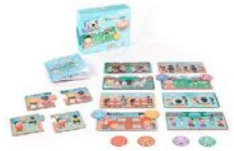
EMOTIDUOS: JUEGO PARA RECONOCER LAS EMOCIONES REF 1-45414

Juego educativo para prevenir el acoso escolar a través de la empatía y el diálogo. Incluye 10 puzzles, 8 caritas de emociones, una guía y un folleto para ayudar a los niños a reconocer sentimientos y fomentar el trabajo en equipo. Desarrollado en colaboración con la Fundación Anar. Recomendado a partir de 2 años.