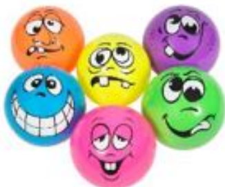
PELOTAS CARAS DE EMOCIONES REF 50-M440135

Ayude a los niños pequeños a identificar y expresar sus sentimientos y emociones con este juego de 10 saquitos táctiles. Cada bolsa tiene impresa la imagen de una emoción: feliz, triste, enfadado, sorprendido, amado, asustado, tranquilo, excitado, somnoliento y decepcionado, en un color y una textura que corresponden a esa emoción. Recomendado a partir de 3 años.