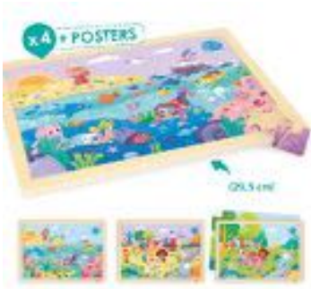
ECO-PUZZLES: ¡SALVEMOS EL PLANETA! REF 13-52270

Set de 4 puzzles de madera que muestran la importancia de un desarrollo sostenible para conservar el planeta. Cada puzzle mide 29,5x22 cm. Hay 2 puzzles de 24 piezas y 2 puzzles de 35 piezas. Recomendado de 4 a 7 años.