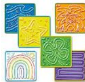
SET DE LABERINTOS MINDFUL REF 137-93247

Juego interactivo para que los niños practiquen yoga, mindfulness y relajación de forma divertida. Incluye 24 tarjetas ilustradas y una ruleta que guía actividades para fomentar la calma, concentración y bienestar emocional. Adaptado a cada etapa infantil, ayuda a gestionar emociones y desarrollar habilidades de autorregulación. Recomendado a partir de 2 años.