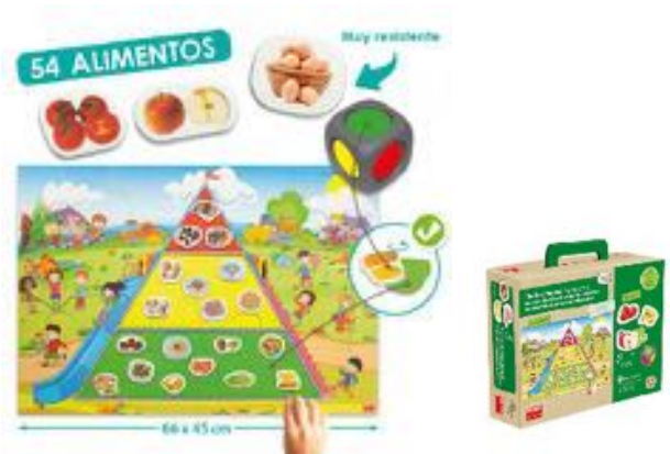
PIRÁMIDE DE LA BUENA ALIMENTACIÓN REF 13-20554

Lanza el dado y completa la pirámide con los alimentos correspondientes al color del dado, teniendo en cuenta que el color verde es para alimentos que hay que comer "a veces" y el rojo aquellos que oslo se han de comer "ocasionalmente". Puzzle de 66 x 45 cm con la pirámide de la alimentación, dado de 3,5 cm, 54 piezas de alimentos y un póster. Edad recomendada: de 3 a 8 años.