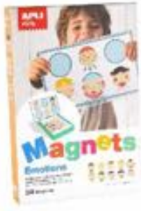
MAGNETS ESTADOS DE ANIMO REF 73-14803

Juego magnético para combinar las piezas de la cara y representar las diferentes emociones. Se juega sobre un escenario extraíble que se encaja en la base de la caja. El niño deberá crear rostros combinando tres piezas intercambiables. Cada pieza refleja características y estados de ánimo diferentes, lo cual permite crear múltiples combinaciones. Recomendado a partir de 3 años.