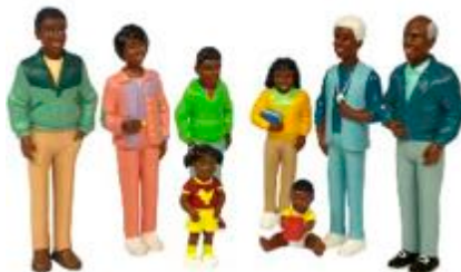
FAMILIA AFRICANA REF 1-27396