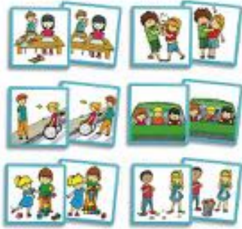
LOS BUENOS MODALES: EL COLEGIO REF 13-20801

Serie de juegos de asociación de parejas, que muestran un buen y un mal comportamiento, en diferentes situaciones del entorno cotidiano del niño. 34 fichas. De 3 a 8 años.