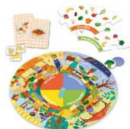
CUIDANDO EL PLANETA: LOS ALIMENTOS REF 10-1120200188

Lanza el dado y completa la pirámide con los alimentos correspondientes al color del dado, teniendo en cuenta que el color verde es para alimentos que hay que comer "a veces" y el rojo aquellos que oslo se han de comer "ocasionalmente". Puzzle de 66 x 45 cm con la pirámide de la alimentación, dado de 3,5 cm, 54 piezas de alimentos y un póster. Edad recomendada: de 3 a 8 años.