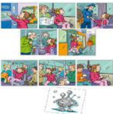
HACERLO BIEN REF 287-L12121

Este juego de sociedad permite abordar los usos y el respeto por las reglas de la vida escolar. Las buenas maneras en el colegio estimulan el debate y "la vida en sociedad" en el colegio. La caja contiene: 1 tablero de cartón, 24 tarjetas ilustradas, 20 fichas redondas, 4 fichas de jugador de plástico, 1 dado, reglas del juego. Recomendado para niños a partir de 4 años.