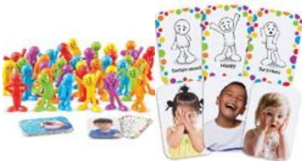
JUEGO ACTIVIDADES MIS SENTIMIENTOS REF 137-LER3368

Con este kit, los alumnos aprenderán a enfrentarse a situaciones difíciles, a funcionar mejor en familia, la escuela y la sociedad en general. Contenido: 1 Photon Robot, 50 actividades, 1 alfombra educativa (cuadrícula), 1 alfombra educativa (historia), 1 cubo educativo, 50 pegatinas de nombre. Recomendado de 6 a 11 años.